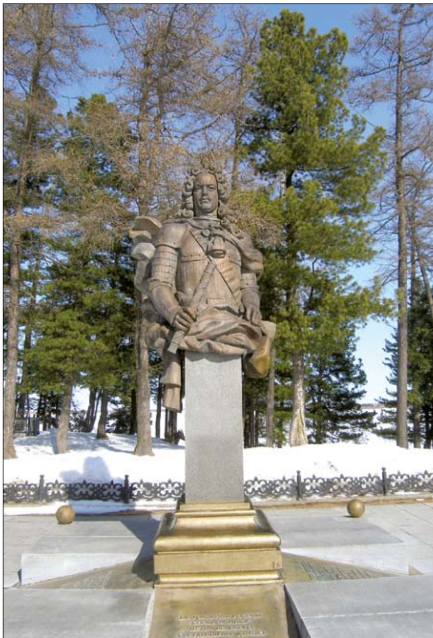
Ил. 2. Берёзово. Памятник Светлейшему князю. 2013 г.