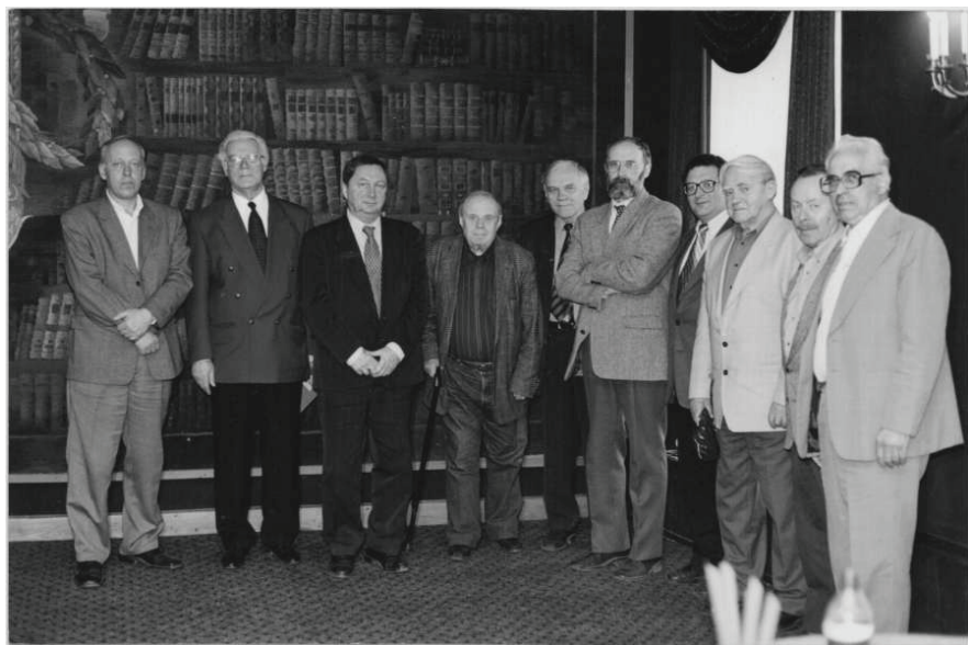
С учеными и писателями Санкт-Петербурга. Фотография 2002 г.