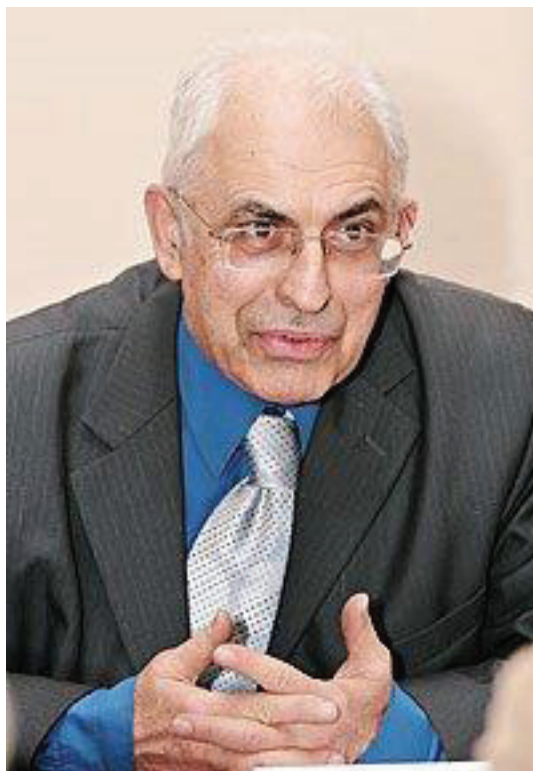
Владлен Семенович Измозик