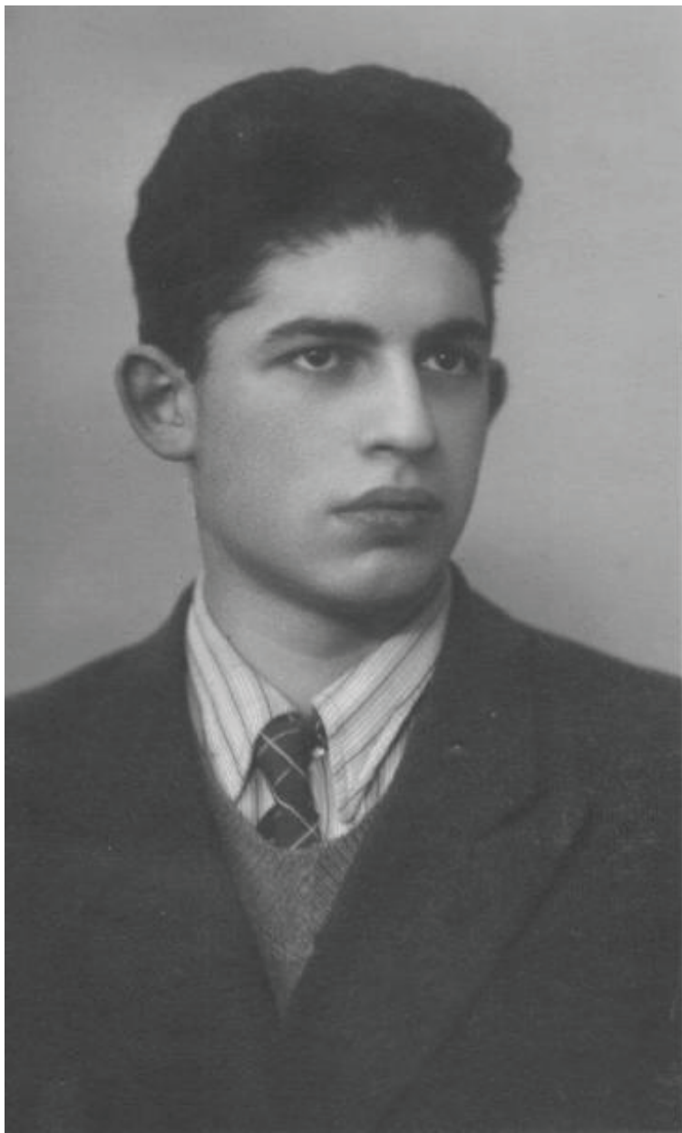
Фотография 1955 г.