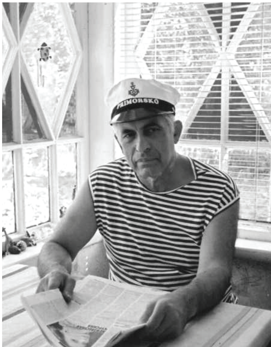
На даче в Синявино. Фотография 2011 г.