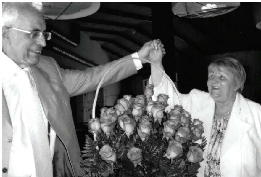
Юбилей свадьбы. Фотография 2010 г.