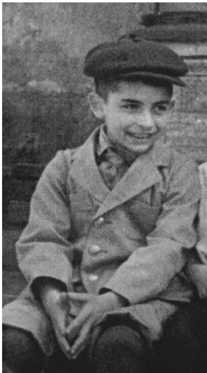
Фотография 1946 г.