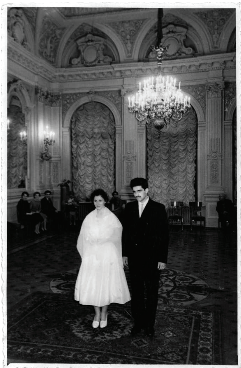
Торжественное бракосочетание. Фотография 1960 г.