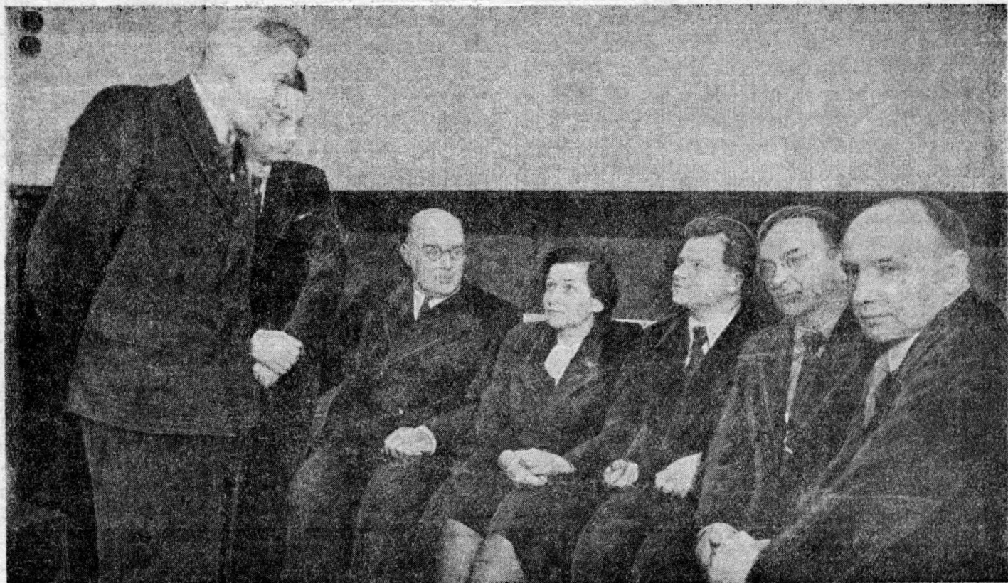
Президиум собрания во время перерыва

мысль, распространив ее на гармонию и на полифонию. Действительно, сочинить тональную фугу значительно труднее, чем атональную, равно как мыслить в ладовой системе труднее, чем в тех случаях, когда пренебрегают гармонической логикой.