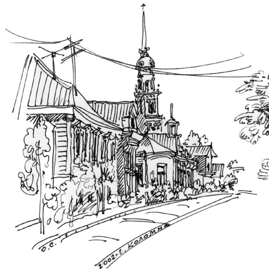
г. Коломна, Московская область. Рисунок О. Севан, 1987 г.