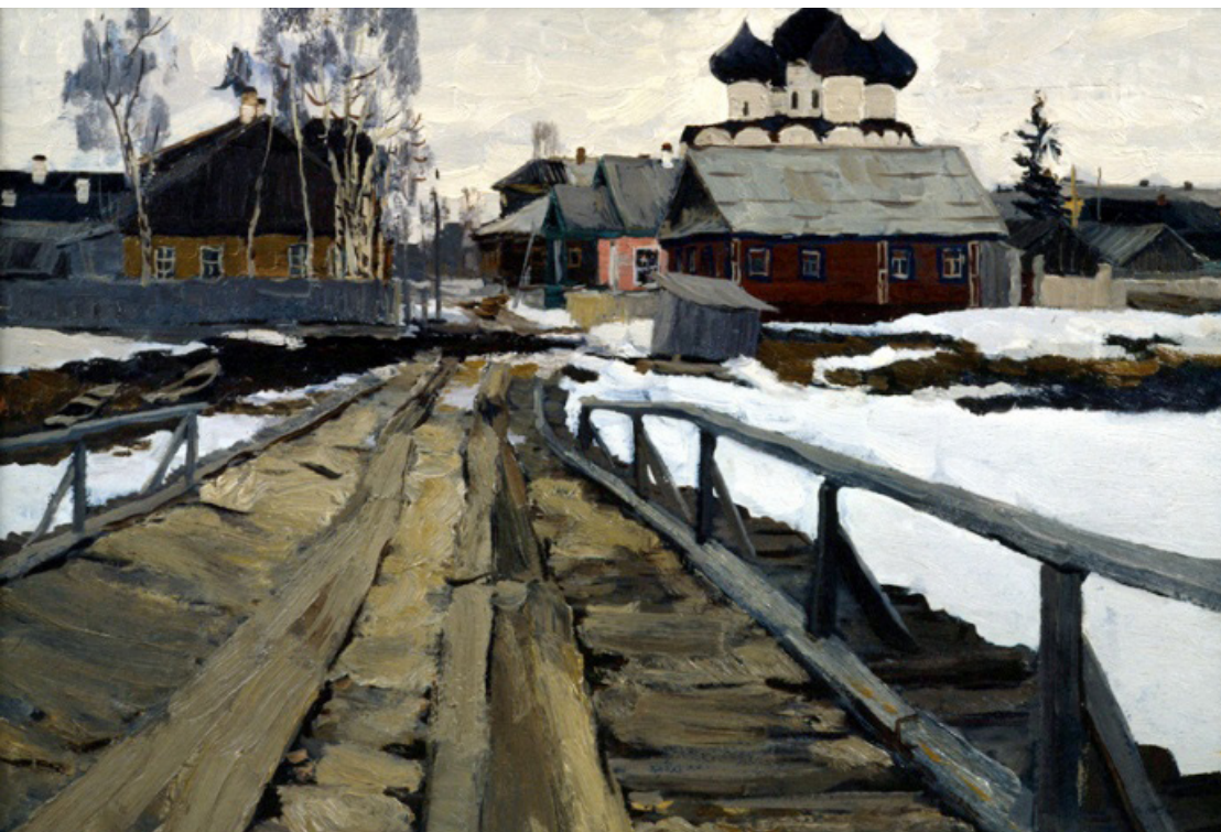
В. Ф. Стожаров. Город Каргополь. 1960-е гг.

общественности в тот период привлекла тема традиционного народного костюма и сохранения обрядности 5 .