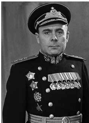
Адмирал Арсений Григорьевич Головко

Головко мог спорить с наркомом ВМФ Николаем Герасимовичем Кузнецовым. Мог говорить резкости в Ставке Верховного Главнокомандования. Но на его решениях не могло не сказаться знание тех потерь, которые нёс флот страны от репрессий и до войны, и в период неё. Корабли – «игрушки» дорогостоящие, и гнев Сталина, который узнавал о гибели их, был велик. Кстати сказать, и Г.К. Жуков флот не жаловал. Возможно, поэтому и не стал адмиралом