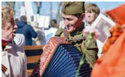
Песни под гармонь. Автор – Полина Нечаева