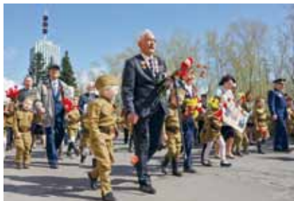
Бессмертный полк на марше.