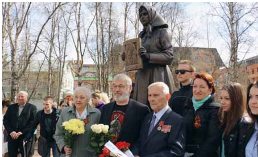
На открытии памятника «Жителям военного Архангельска 1941–1945 годов» в сквере Победы. Май 2015 года