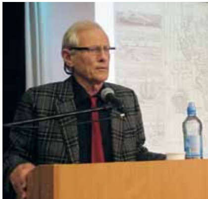
Доклад норвежского исследователя В. Гортера

зованию северных территорий, вопросам сохранения и популяризации художественного наследия Русского Севера. Логическим итогом работы секции стали предложения в адрес министерства культуры и министерства образования и науки Архангельской области по ускорению темпов музеефикации памятников культуры с целью включения региона в туристический кластер «Серебряное кольцо России» и финансовой поддержки школьного туризма с целью изучения памятников истории и культуры региона, популяризации краеведческих знаний. Кроме того, участники и слушатели высказали пожелание организовать единое информационное пространство краеведов-исследователей на основе специального сайта на базе Интеллектуального центра научной библиотеки САФУ, Архангельского областного краеведческого музея или иной организации. В рамках культурной программы все участники смог-