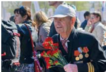
Низкий поклон всем пережившим войну. Автор – Полина Нечаева