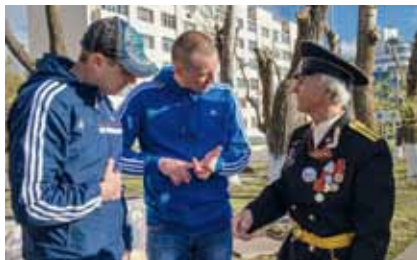
Серьёзный разговор. Автор – Ксения Чемакина