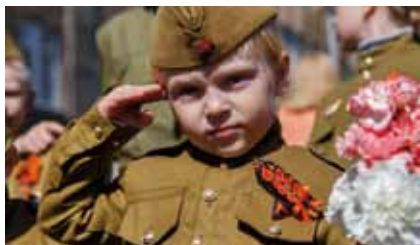
Служу России!

На фотоконкурс «Русский Север» после праздника 9 Мая в номинации «События года» поступило много работ. Мы публикуем подборку наиболее понравившихся снимков. Все вместе они передают праздничное настроение горожан, гордость за наших отцов, дедов и прадедов, отстоявших свободу и независимость нашей Родины. Фотоконкурс продолжается, и мы ждём ваших работ.