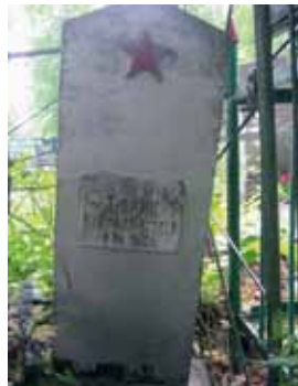
Захоронение № 2 на кладбище в Фельшинках

снимке ромбом схематично указано место расположения кладбища.