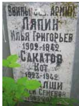
Захоронение № 1 на кладбище в Фельшинках