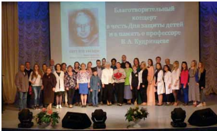
Участники благотворительного концерта