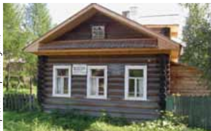
Дом-музей Сталина в Сольвычегодске

Северная ссылка И. Джугашвили в общей сложности продолжалась 18 месяцев. В Сольвычегодске, между прочим, его хорошо знали не в качестве негибкого героя-революционера, а в качестве «чудака Иосифа» да ссыльного бабника, немало наследившего на Вологодчине.