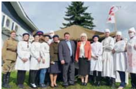
Участники инсценировки работы военно-полевого госпиталя