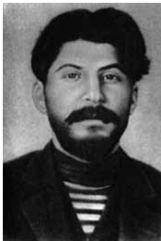
И.В. Сталин во время вологодской ссылки

Такая кадровая политика не могла не сказаться отрицательно на развитии региона. План лесозаготовок 1938 года был выполнен лишь на 56%, вывозки древесины на 65%, не лучше было положение и в 1939 году, общий рост промышленного производства