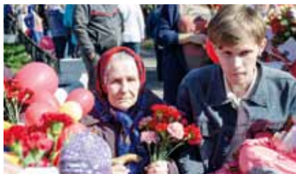
Помним! Автор – Александра Игнатенко