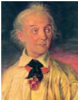
Н.А. Шабунин. Портрет А.В. Суворова, 1900 г.

картина Николая Авенировича «Вид усадьбы Суворова села Кончанского. Светёлка на горе Дубиха» 1900–1907 г. (холст, масло, 80×127 см).