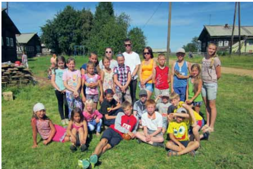
Участники детского праздника

Сейчас Кельчемгора переживает новый этап своей истории. Летом кипит жизнь, из разных уголков страны почти в каждый дом приезжают потомки тех, кто в своё время поднимал деревню. И можно с уверенностью сказать, что школьная тропинка вновь будет протоптана и возле памятной доски будут звучать детские голоса.