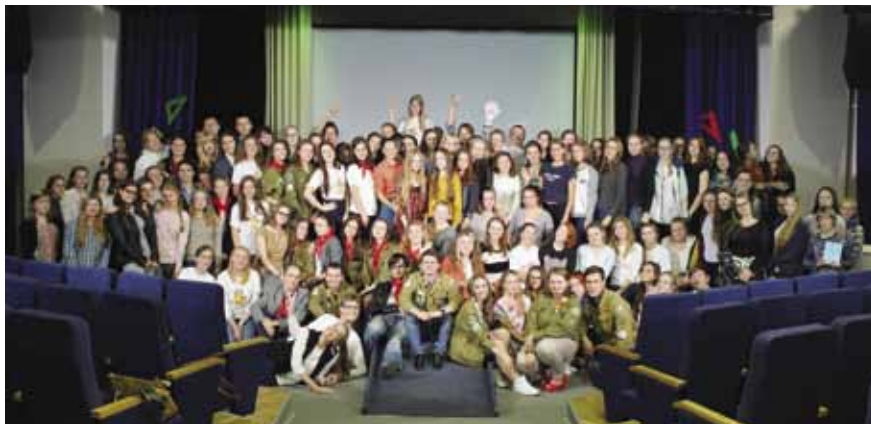
Открытие «Школы вожакого» при добровольном студенческом подотряде «Опора»

государственного медицинского института на строительстве Савинского цементного завода. Потом будет четверть века развития отрядов не только строительного, но и других направлений: медицинских, педагогических, экскурсоводов, проводников и... затишье в те самые сложные,