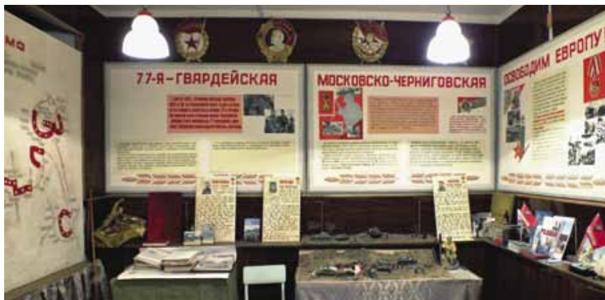
Музей в школе № 93 г. Архангельска

После расформирования дивизии многие офицеры и прапорщики пополнили кадры подразделений пограничных войск, учебного пограничного отряда и созданной в Архангельске средней школы милиции, а также сформированной затем на Кавказе бригады морской пехоты. Офицеры и прапорщики, уволенные в разные годы в запас, внесли и вносят свой вклад в социально-экономическое развитие Архангельской области и Ненецкого автономного округа. Они достойно трудились и трудятся в органах власти, на предприятиях, в военных комиссариатах, в учебных заведениях.