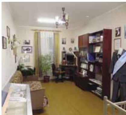
Восстановленный прижизненный домашний кабинет краеведа