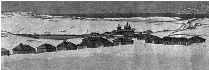
Новый город Александровск на Мурмане