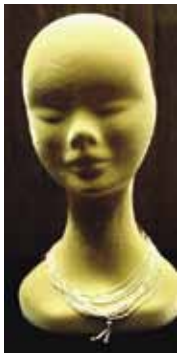
Поморский жемчуг из фондов музея

в Саксонию послан, также химия и физика».