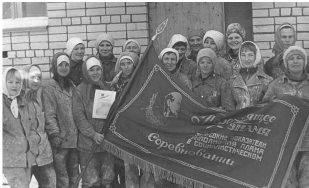
Комсомольско-молодёжная бригада строителей

студенческие строительные отряды понесли по стройкам области и в 1968 году. Мне довелось тогда третий раз выехать на строительство железной дороги Архангельск–Карпогоры своим отрядом, и мы реально спасли стройку от разбушевавшейся реки Пинеги. Работа многих выездных стройотрядов тогда была высоко оценена в нашей области на транспортном строительстве, на объектах объединения «Архангельсклесстрой», на электрификации северных сёл. Успех определяли студенты-романтики, объединённые вузовским комсомолом в стройотряды на принципах «коммун», с огромным желанием проявить себя в коллективе друзей, с хорошей подготовкой по строительным профессиям, по технике безопасности. Студенты добивались высокой производительности труда, порой обгоняя строителей.