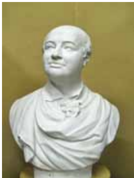
Копия бюста Ломоносова работы Ф.И. Шубина

Он смог доходчиво объяснить, что недра нашей планеты таят несметные сокровища – минералы. Их неописуемое разнообразие и красота всегда покоряли человеческие сердца. Ещё в детстве юный Михайло, ходя с отцом на промыслы, с удивлением наблюдал, как поморские ловцы жемчуга ловкими движениями извлекали из раковины диковинный камень, а в варницах (ямах) в огромных железных сковородках (цренах) вываривалась знаменитая «поморка» – соль. Как по берегам Белого моря промышленляли поморы бивни древних мамонтов, голубую кость, а на далёком острове Медвежьем находили самородное серебро. Детские наблюдения пригодились будущему учёному. Ведь только видевший человек может так подробно описать расположение серебра: «В земле оно находится часто очень чисто, а больше в листках или волосам подобной тон-