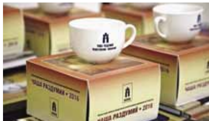
«Чаша раздумий-2016» ждёт своего лауреата

В своём выступлении он отметил, что книги по тематике оргкомитет отобрал еще в начале года. Каждую