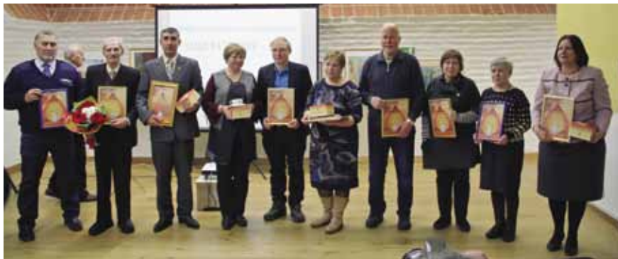
Лауреаты премии «Чаша раздумий – 2016»

Сотрудник Архангельского областного краеведческого музея, член культурно-просветительно-