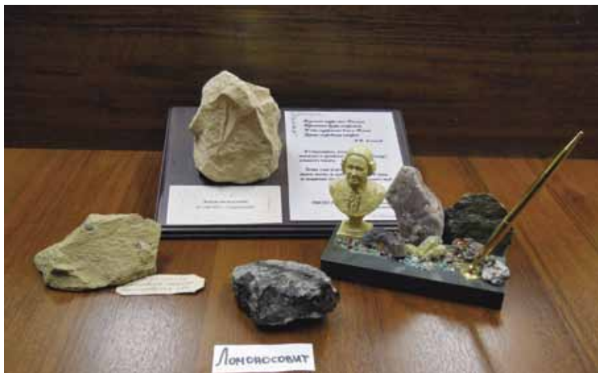
Минералы в фондах музея

В тесной связи с географическими начинаниями Ломоносова нахо-