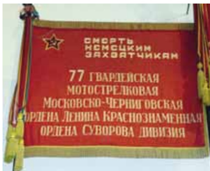
Боевое Знамя 77-й гвардейской дивизии в Центральном музее Вооружённых сил России

Дивизия сформирована в Москве в июле 1941 года как 21-я Московская дивизия народного ополчения. В сентябре переименована в 173-ю стрелковую дивизию (2-го формирования). В первый бой с немецко-фашистскими захватчиками вступила в составе 33-й армии Резервного фронта 2 октября 1941 года в ходе битвы под Москвой. В конце октября – начале декабря в составе Западного фронта (с 21 ноября входила в него 50-я армия) вела тяжёлые оборонительные бои в р-не городов Белёв, Венёв, Кашира. С началом контрнаступления советских войск на западном