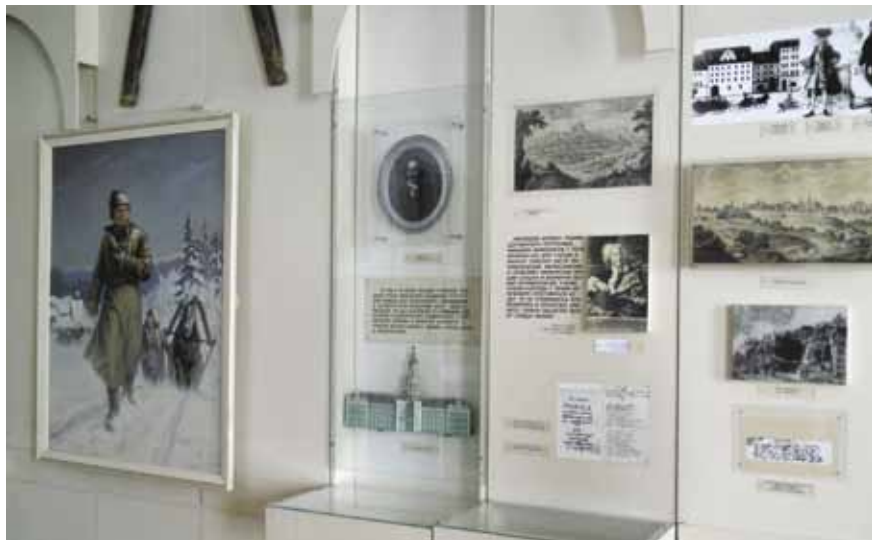
Металлургия в Марбурге в экспозиции музея

М.В. Ломоносов высказал ряд важных идей, раскрывая тайны земли и происходящих в ней геологических процессов, он видел в минералогии и геологии прежде всего науки, изучение которых просто необходимо для поисков полезных ископаемых. В своём «Слове о рождении металлов от трясения земли» он за 60 лет до Юнга выдвинул идею о «нечувствительных землетрясениях», то есть медленных колебаниях земной коры.