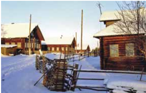
Деревня Нижнее Золотилово. 2010-е годы