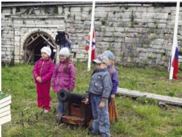
Дети у стен Новодвинской крепости.