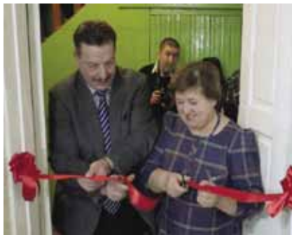
Торжественный момент перерезания красной ленточки