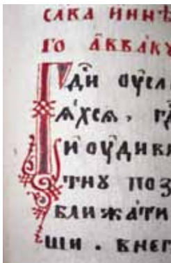
Рукописи Архангельского Севера украшены заставками поморского старопечатного стиля с элементами растительного орнамента

Севера также украшены заставками поморского, старопечатного стиля с элементами растительного орнамента. Заставки («заставицы») располагались над текстом начальной страницы рукописи или в начале отдельной главы. Старообрядческим художникам были более близки растительные темы.