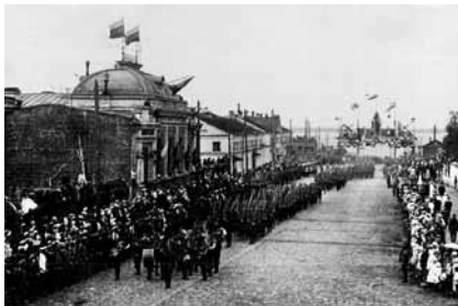
Соборная улица (К. Либкнехта). Встреча интервентов. 2 августа 1918 г.

Около 9 часов вечера «учреждения» были погружены на пароходы «Рюрик» и «Св. Савватий». 2 августа около двух часов ночи «эскадра» отправилась вверх по Северной Двине и в 3 часа дня была уже в Березнике. Здесь руководство, сопровождающее ценности, узнало, что советская власть в Архангельске пала. Проведено экстренное совещание с товарищами из центра. Принято решение: ехать не в Шенкурск, как планировалось, а в Котлас, ибо интервенты сразу же должны были выслать пароходо-канонерки. Ситуация осложнялась