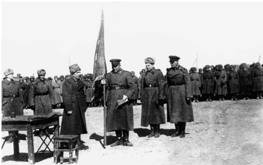
Вручение гвардейского знамени 77-й дивизии

переправилась через реку, в жестоким ночном бою захватила небольшой плацдарм, заняла круговую оборону и в течение одной ночи превратила его в мощный опорный пункт. Несколько раз бойцы отбивали яростные атаки немцев и сами контратаковали. В течение суток поредевшая рота продвинулась на 800 метров и подготовила условия для переправы основных сил дивизии на второй день. 15 воинам роты во главе с командиром было присвоено звание Героя Советского Союза (15 янв. 1944 г.). Подразделение заслужило почётное наименование «Рота Героев». В ноябре 1943 года дивизия участвовала в Гомельско-Речицкой, в январе 1944 года в Калининковичско-Мозырской наступательных операциях. Во взаимодей-