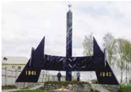
Стела, посвящённая памяти героев 77-й гвардейской дивизии, павших в войне 1941–1945 гг.

В феврале дивизия вышла к реке Одер, форсировала её и захватила плацдарм у города Кюстрин. За отличие в боях и массовый героизм воинов при освобождении территории Польши дивизия награждена орденом Ленина (19 февр. 1945 г.). Свой боевой путь она закончила в Берлинской наступательной опе-