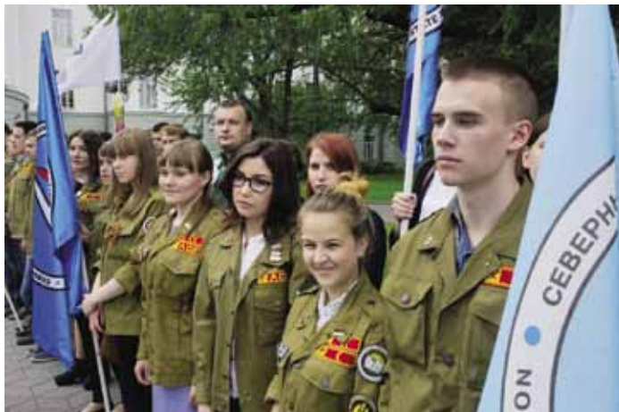
Открытие третьего трудового семестра 2016 года у главного корпуса САФУ

Юбилею посвящался 4-й окружной слёт молодёжных трудовых и студенческих отрядов Северо-Западного федерального округа, открытие которого состоялось в Северном (Арктическом) федеральном университете имени М.В. Ломоносова. В его работе приняли участие отряды не толь-