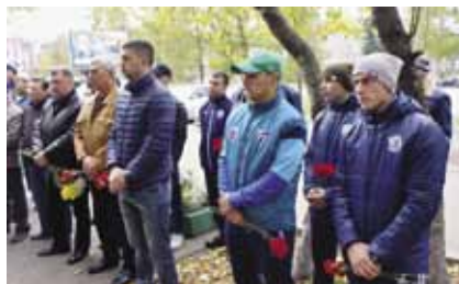
На митинге открытия мемориальной доски