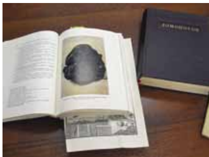
Книги из собрания сочинений М.В. Ломоносова

М.В. Ломоносов высказывает идею о постоянных изменениях, происходящих в земной коре. На то время она намного опережала состояние современной ему науки. Он писал: « Твёрдо помнить должно, что видимые телесные на земле вещи и весь мир не в таком состоянии были с начала от создания, как ныне находим, но великие происходили в нём перемены... ». Ломоносов предлагает свои способы определения возраста руд, происхождения вулканов, именно Ломоносову принадлежит первое объяснение природы вулканов как