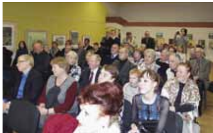
Во время проведения церемонии вручения премии

Эта номинация введена впервые. Вызвано это тем, что появляется много книг по деревянному зодчеству, северным храмам, а отнести их в другие категории не представлялось возможным. В этой номинации было четыре работы, и все удостоены различных наград. Дипломом с