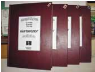
Мартиролог Бакарицкой трагедии

Первый том – это свод имён, разделённый на главы: пострадавшие, пропавшие, погибшие. Завершают его главы «О местах упокоения», «Спасатели», «Благодарители».