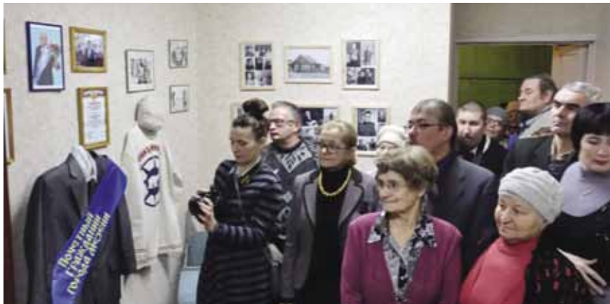
На открытии кабинета краеведа

им в период работы над своими произведениями.