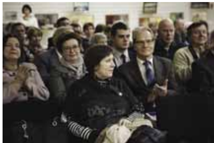
Полный зал заинтересованных людей

И ещё одна специальная награда, которая вручается на церемонии «Чаша раздумий»: за преданность журналистике и вклад в патриотическое воспитание северян награждён дипломом «За службу земле Поморской» старейший журналист нашей