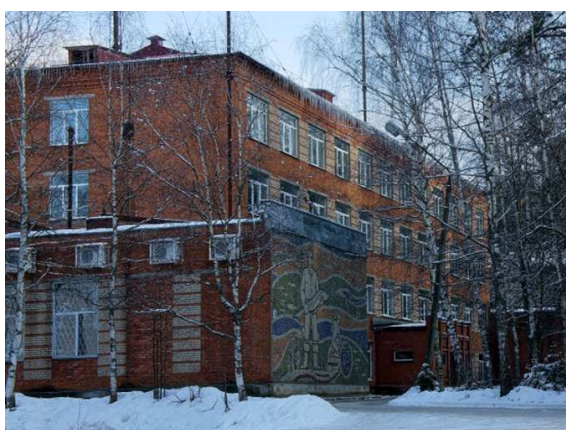
Рис. 7. Дмитровский рыбопромышленный колледж.