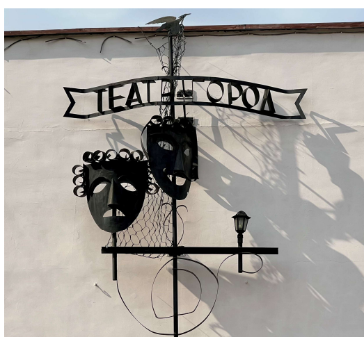
Рис. 19. Оформление фасада театра «Город»