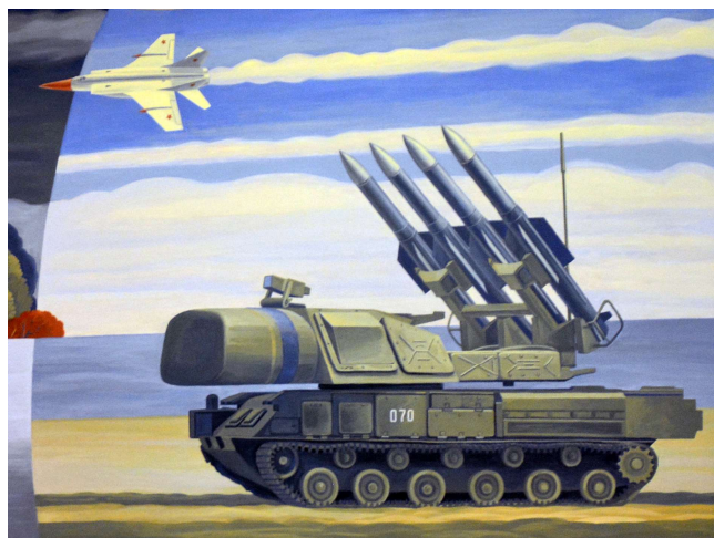
Рис. 12. Российский взлёт. Роспись 2 этажа музея ДНПП. Фрагмент