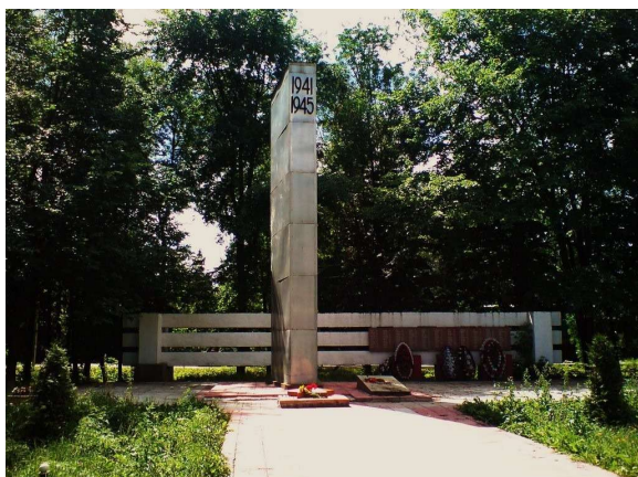
Рис. 5. Стелла павших Героев войны в Катугаре