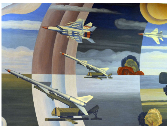
Рис. 13. Российский взлёт. Роспись 2 этажа музея ДНПП. Фрагмент