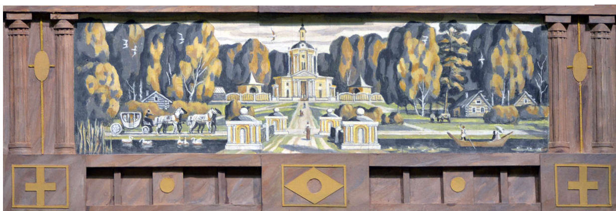
Рис. 18. Виноградово. Эскиз мозаики для оформления выставочного зала на 2 этаже ДК «Вперёд». Оргалит, картон, темпера. 29х85 см.