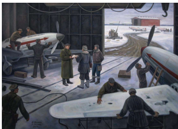
Рис. 25. Долгопрудный в годы войны. Холст, масло. 80x110.