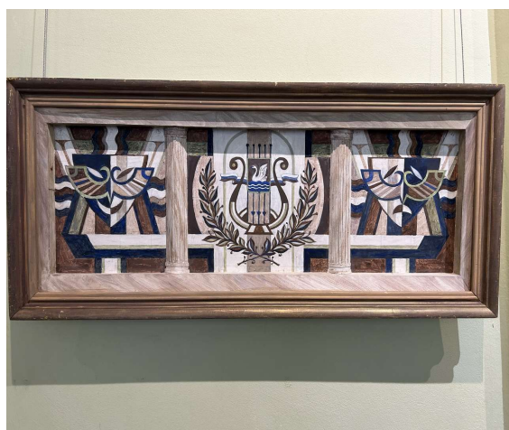
Рис. 15. Виды искусства. Эскиз для панно из флорентийской мозаики в ДК «Вперёд». Оргалит, темпера. 26x69 см.