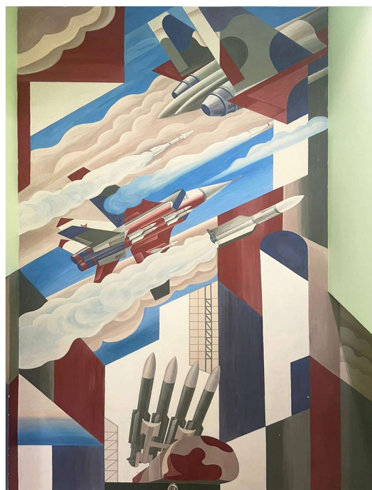
Рис. 10. От дирижаблей до ракет. Роспись 1 этажа музея ДНПП