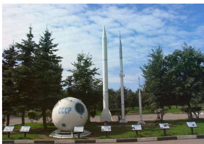
Рис. 20. Композиция гидрометеорологической техники в сквере кинотеатра «Полёт» (ул. Дирижабельная)