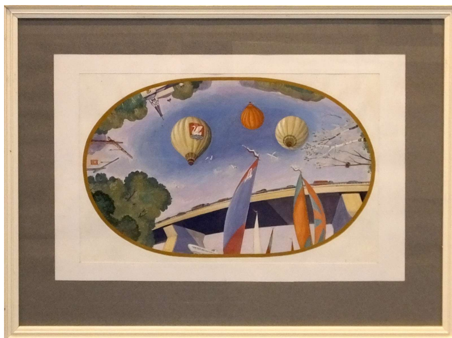
Рис. 17. В новые времена. Потолочный плафон танцевального зала ДК «Вперёд». Бумага, темпера. 45х60 см.