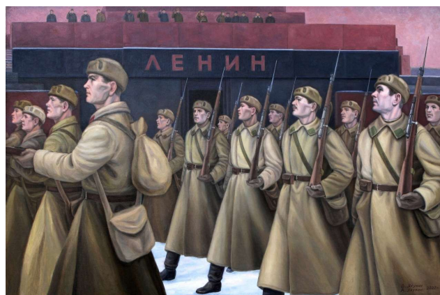
Рис. 26. Наше дело правое. Холст, масло. 80x120.