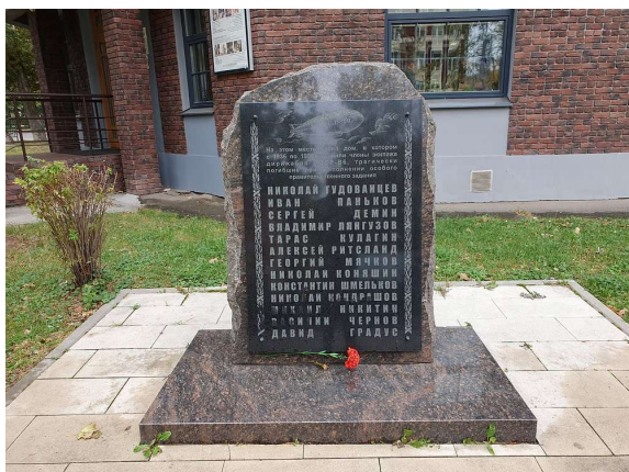
Рис. 21. Мемориальная доска 13 членам экипажа дирижабля СССР-B6