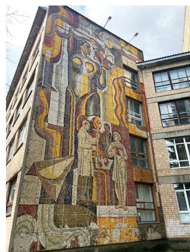
Рис. 2. Яхромский аграрный колледж. Мозаика «Наука»