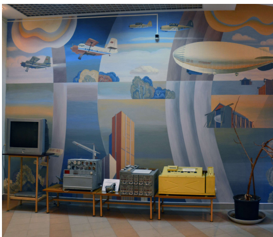
Рис. 11. Российский взлёт. Роспись 2 этажа музея ДНПП