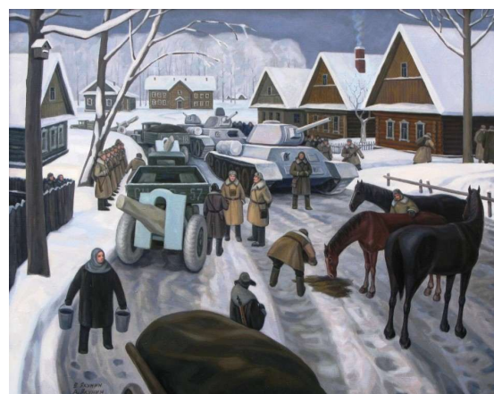
Рис. 24. Прибытие сибиряков в Подмоскowie. Холст, масло. 80,2x100 см.