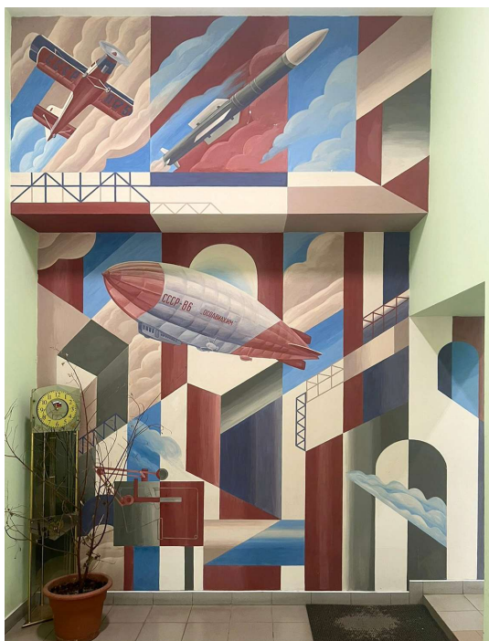
Рис. 9. От дирижаблей до ракет. Роспись 1 этажа музея ДНПП