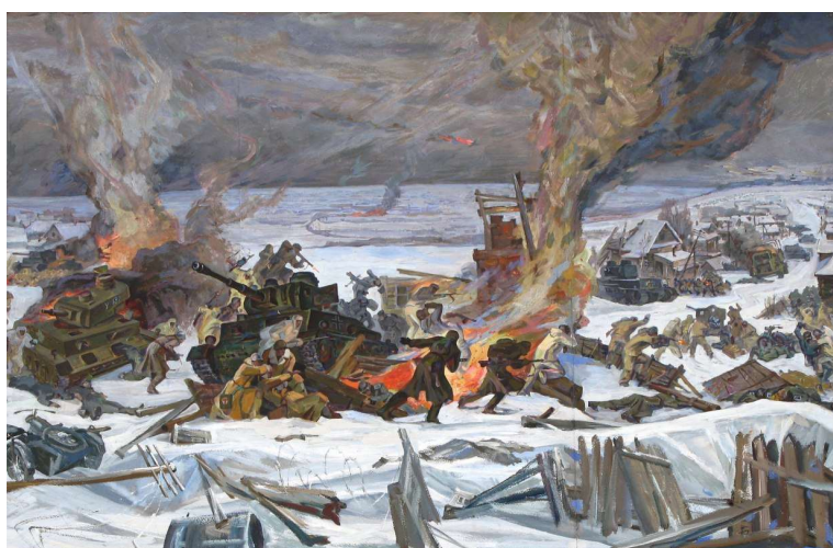
Рис. 4. Эскиз диорамы «Разгром немецко-фашистских войск под Москвой в районе Яхромы». 80×120 см.