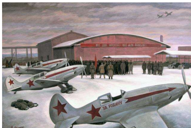
Рис. 22. Долгопрудный фронту - 1941 г. Бумага, гуашь, темпера. 50X70 см.