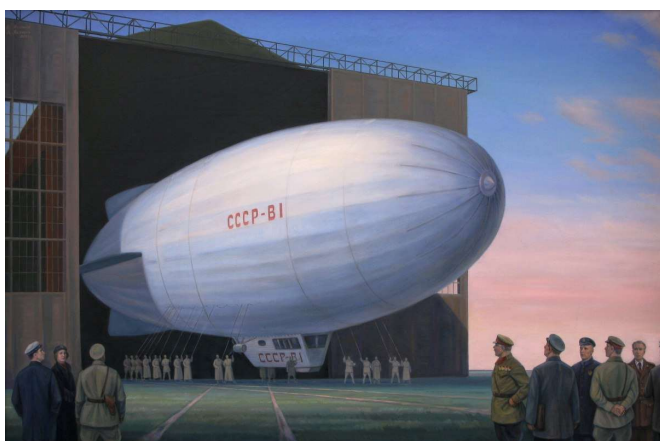
Рис. 23. Дирижаблестрой. Холст, масло. 80x120.