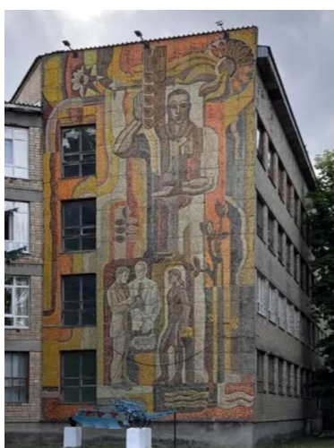
Рис. 3. Яхромский аграрный колледж. Мозаика «Сельское хозяйство»