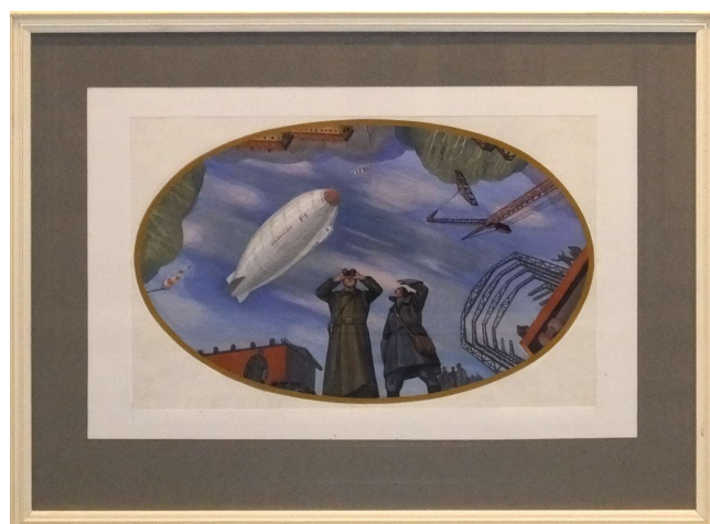
Рис. 16. Дирижаблестрой. Потолочный плафон танцевального зала ДК «Вперёд». Бумага, темпера. 45x60 см.