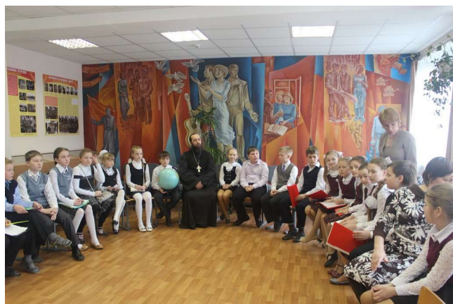
Рис. 6. Роспись в интерьере Дмитровской средней школы № 1, современный вид