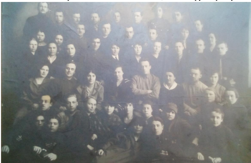
Участники Первого Всероссийского библиотечного съезда. Москва, 1924 год