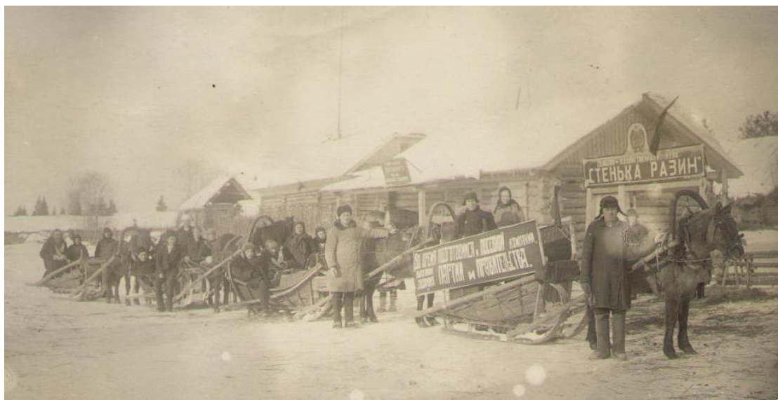
«Культурный десант». Фалёнки, 1930 год