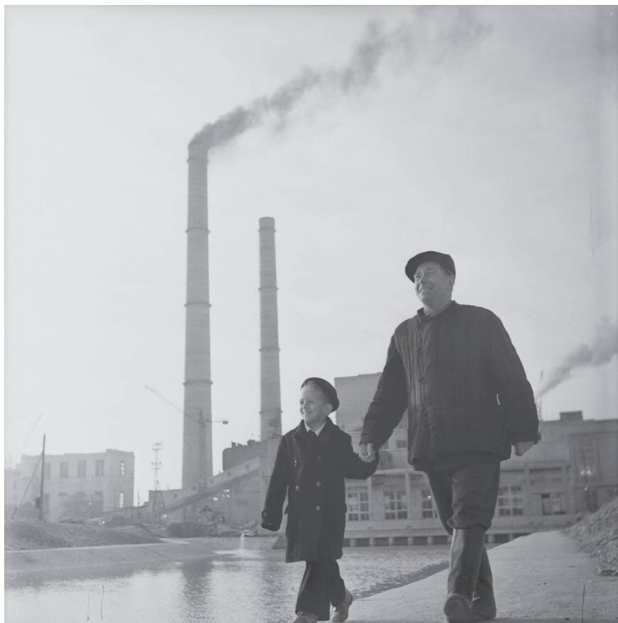
Отец и сын. Фотоэтиюд. [1960-е гг.]. Ленинград. Оп. 1АР-36. Ед. хр. 58261