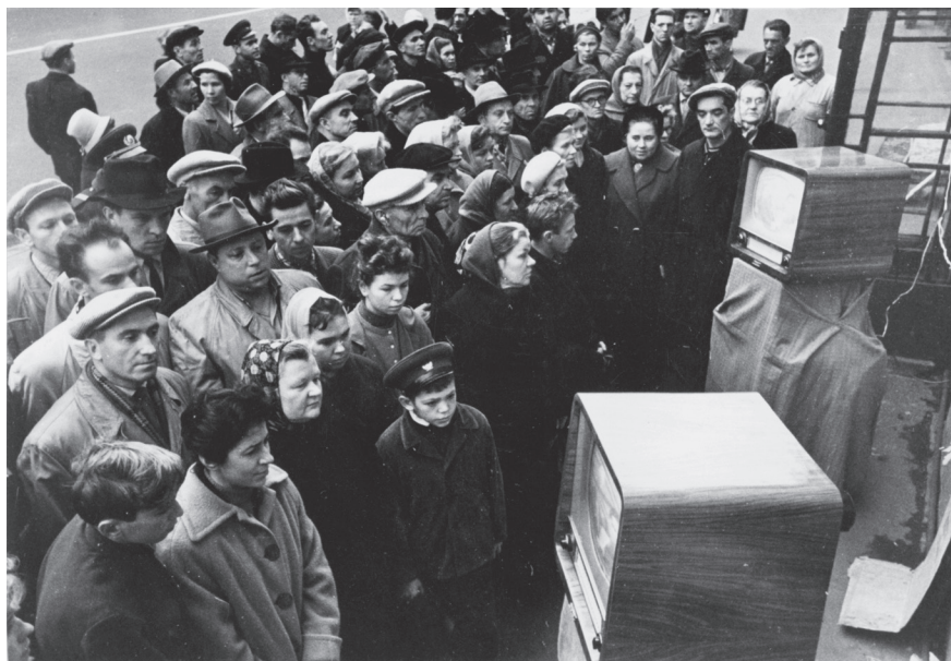
Ленинградцы слушают и смотрят по телевидению выступление Председателя Совета Министров СССР 1-го секретаря ЦК КПСС Н.С. Хрущева на Невском проспекте у дома № 18. 1958 г. Ленинград. Оп. 1АР-119. Ед. хр. 162969.

же большее значение на них при планировании своего досуга оказывало качество тематического вечера, диспута и т. д.