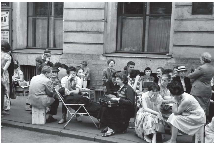
Ленинградцы, слушатели Ленинградской государственной филармонии в ожидании продажи билетов у здания филармонии на площади Искусств. [1950-е – 1960-е гг.]. Ленинград. Оп. 1АР-112. Ед. хр. 154240.

Противоположная ситуация складывалась вокруг кинотеатров, интерес к которым среди горожан был высок как в 1950-е, так и в 1960-е гг. В 1950 г. количество посещений киносеансов составило 30,7 млн человек, при этом частота посещений на каждого ленинградца в год равнялась 11, в 1966 г. эти цифры возросли до 72,1 млн и 20 1 , в 1970 г. достигли 82,1 млн и 21 2 посещений соответственно. Популярность фильмов среди ленинградцев привела к нехватке мест в кинозалах уже в конце 1950-х гг. Стремясь решить эту проблему, городские власти развернули строительство кинотеатров по всему городу, особенно в новых городских районах. В 1953 г. начали работать два новых кинотеатра на проспекте имени И.В. Сталина в Московском и на Малой Охте в Калининском районах 3 . В 1956 г. открылись еще