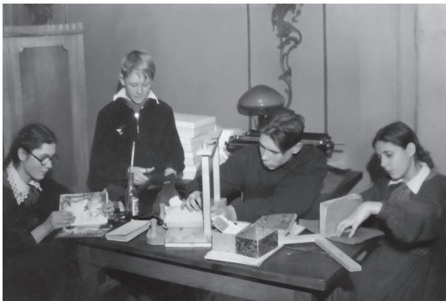
Участники кружка «Друзья книги» за работой. 1962 г. Ленинград. Автор съемки: неизвестен. ЦГАЛИ СПб. Ф. 105. Оп. 1. Д. 1383. Л. 11.

Ленинградские власти реализовывали указания союзных институтов власти и проводили тематические доклады читателей, художественные чтения, молодежные литературные субботники 1 , лекции о советской литературе, кино-литературные вечера, встречи с писателями и учеными 2 . Более того, отвечая на изменяющиеся запросы человека, библиотеки предлагали новые формы культурно-массовой деятельности. Так, желая удовлетворить возрастающие потребности населения в общении и активных формах свободного времяпрепровождения, осенью 1959 г. в библиотеке ДК им. Первой пятилетки был создан «Клуб друзей книги», в рамках которого не только проходило обсуждение прочитанных книг и журналов, но и проводились лекции, обзоры, консультации, организовывались тематические вечера, встречи с писателями и художниками, кружки рецензентов и переплетчиков и т. д. 3