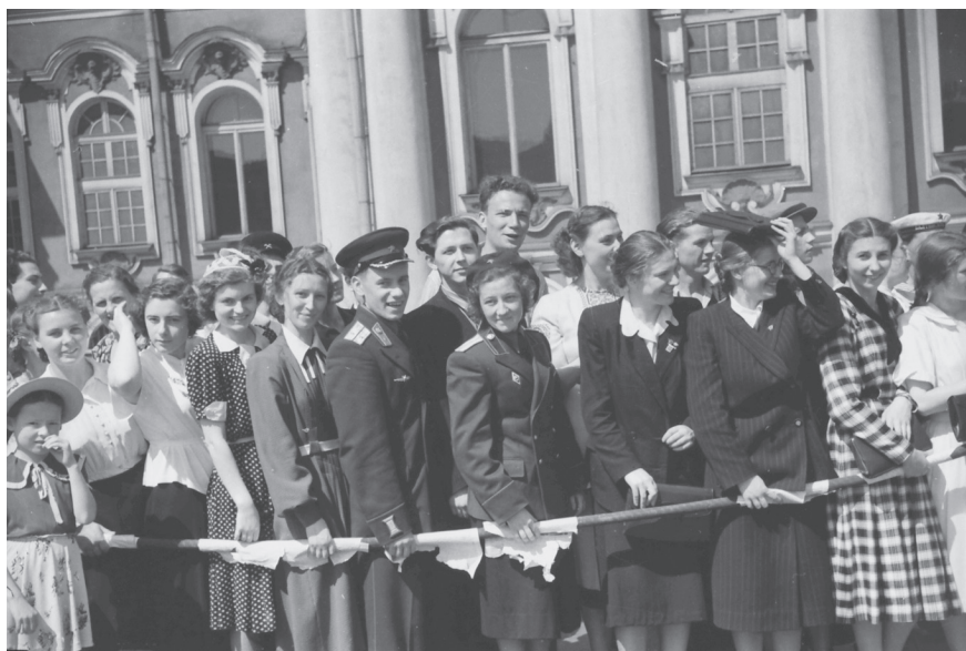
Зрители у здания Государственного Эрмитажа наблюдают за пионерским парадом на Дворцовой площади. 1960 г. Ленинград. Автор съемки: Б.Е. Ритов. ЦГАКФФД СПб. Оп. 1АР-118. Ед. хр. 162299.

ны. Для этого ровно в полдень 28 мая 1967 г., на площадь ЦПКиО им. С.М. Кирова, выехала колонна мотоциклистов с броневиком во главе. Кавалькада машин доставила в парк из музея Великой Октябрьской социалистической революции стяги петроградских рабочих и солдат, знамя «Авроры», знамена орденосных заводов и фабрик, факел, зажженный на старейшем предприятии Петроградской стороны – заводе «Ленинская искра» 1 . Конечно, гуляния такого масштаба проводились не очень часто и были приурочены к знаковым датам из жизни страны, партии, города, но как таковая форма отдыха она организовывалась регулярно.