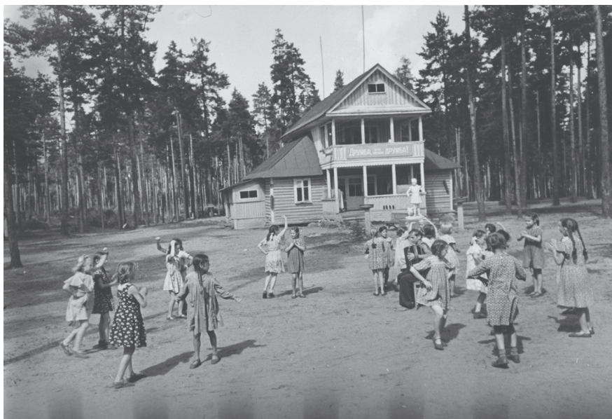
Группа девочек за разучиванием танца во время отдыха на даче. 1950-е гг. Ленинградская обл. Автор съемки: Б.Е. Ритов. ЦГАКФФД СПб. Оп. 1АР-118. Ед. хр. 162483.

конкурса» 1 . Интересно подчеркнуть, что первоначально работа студии (создана осенью 1958 г.) не вызывала нареканий со стороны партийных органов. Так, на конкурсе современного танца, который проходил в Выборгском ДК, комиссия от горкома КПСС дала положительную оценку творческой деятельности студии. Сложности начались после того как в мае 1959 г. в коллегияу Министерства культуры РСФСР поступила справка, составленная директором и старшим балетмейстером Центрального дома народного творчества им. Н.К. Крупской, в которой высказывалась просьба обсудить работу творческого объединения 2 . В результате всех объяснений и согласований, которые происходили вокруг описанной ситуации, постоянной комиссией по культуре Ленинградского городского Совета было выдвинуто предло-