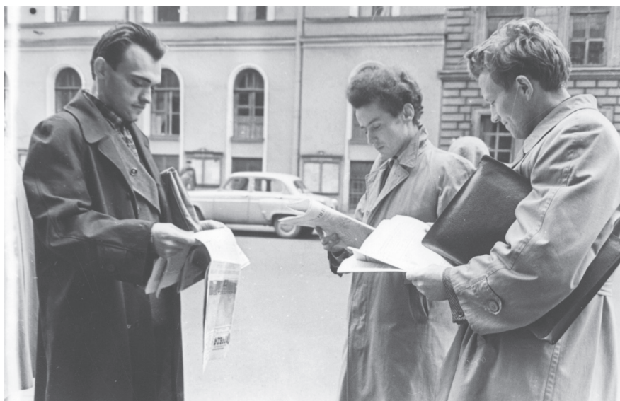
Ленинградцы внимательно просматривают газеты с материалами XXII съезда КПСС на Садовой улице. 19 октября 1961 г. Ленинград. Автор съемки: Н.А. Науменков. ЦГАКФФД СПб. Оп. 1АР-156. Ед. хр. 223753.

до 15.788 1 , по другим, до 22.500. А общее число слушателей возросло с 2.000.000 в середине 1960-х гг. 2 до 5.000.000 к концу десятилетия 3 . Если сопоставить эти показатели с численностью населения СССР в возрасте от 15 лет и старше, то в 1965 г. посещаемость составила 1,36 %, а в 1970 г. – 2,91 %.