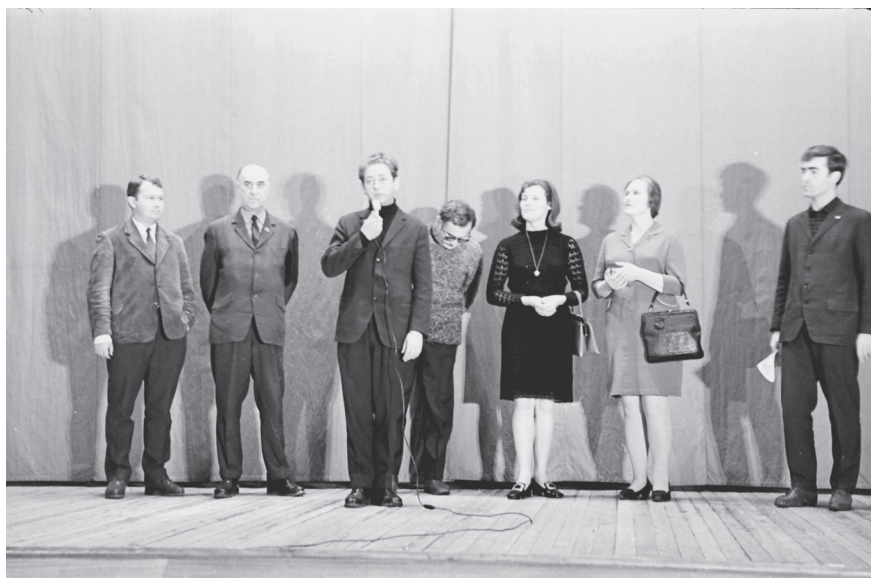
Группа ленинградских кинематографистов, участников смотра кинофильмов, выступает перед рабочими Ижорского завода. Февраль 1970 г. Колпино. Автор съемки: Подушкин. ЦГАКФФД СПб. Оп. 1АР-56. Ед. хр. 91270.

Например, «Театральный поезд», суть которого состояла в том, что для жителей районов Ленинградской области организовывали на целый день экскурсию в один из театров города, после которой они присутствовали на спектакле и встрече с творческим коллективом, на которой посетители и труппа обменивались мнениями и впечатлениями о спектакле. Со зрителями обсуждались не только спектакли, но и фильмы. Например, в середине 1960-х гг. в Большом дворце Петродворца проводились кинособорания, в организации которых принимали участие сотрудники кинотеатра «Аврора», районного дома культуры, садово-паркового комплекса Петродворца и представители районных партийных и комсомольских организаций. На этих встречах жители района высказывали свое мнение о просмотренных фильмах, а сотрудники учреждений культуры объясняли эпизоды кинокартин, которые остались непонятны для зрителей и т. д. 1 Такие формы досуга позволяли посе-