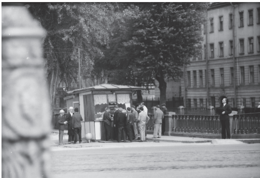
Пивной ларек у Комсомольского моста на набережной канала Грибоедова. Июнь 1967 г. Ленинград. Оп. 1АР-164. Ед. хр. 242926.

ва в другой в течение почти всей своей жизни, но никогда, если все шло нормально, не выпадал из коллектива вплоть до своей смерти» 1 .