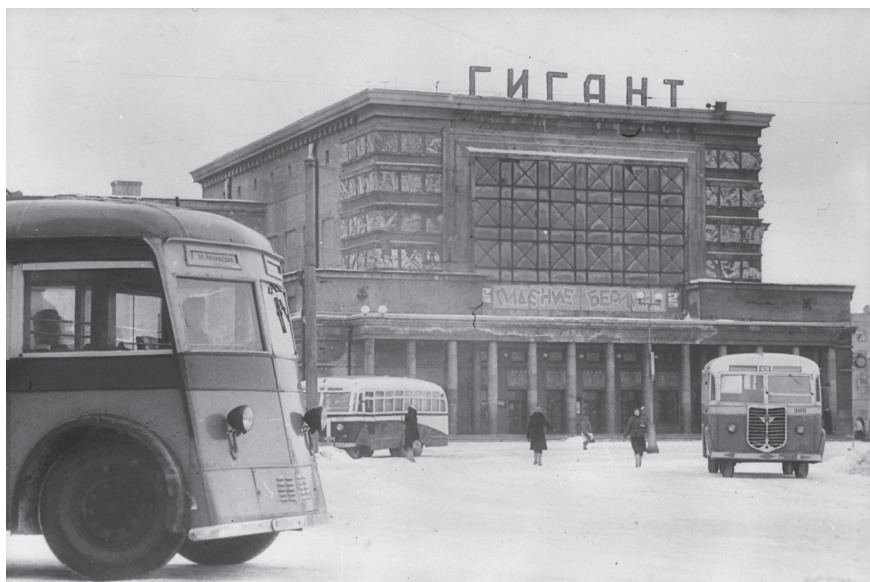
Вид здания кинотеатра „Гигант“ (Кондратьевский проспект, 44). 16 февраля 1950 г. Ленинград. Оп. 1АР-10. Ед. хр. 17485.

два кинотеатра: двухзальный «Дружба» в доме №202 по проспекту имени И.В. Сталина и в здании Исполкома Смольнинского райсовета 1 . Строительство кинотеатров в первой половине 1950-х гг. привело к тому, что к 1956 г. для ленинградцев в городе и пригородах (Петродворец, Пушкин, Стрельна и т. д.) свои двери открыли 61 кинотеатр и 21 киноустановка в Дворцах и Домах культуры 2 . Данные таблицы 9 показывают, что значительная активность строительства кинотеатров и открытие киноустановок пришлось на первую половину 1960-х гг.