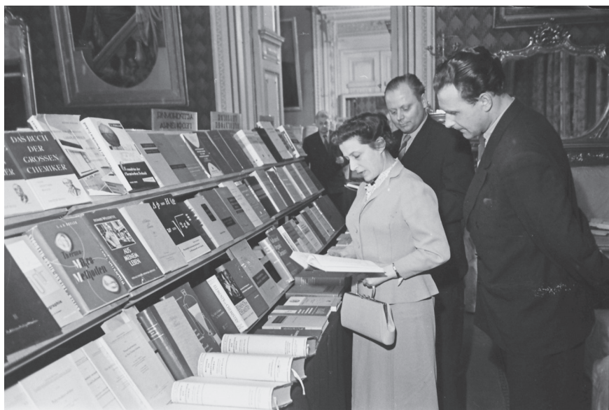
Посетители выставки технической книги, устроенной в Доме ученых, рассматривают экспонаты. 25 марта 1959 г. Ленинград. Оп. 1АР-56. Ед. хр. 91157.

дыха, на котором горожанин мог ознакомиться с книгами и журналами, посетить концерт и кинофильм. Совместные литературные вечера и встречи библиотека проводила и с Таврическим садом. Поскольку произвести точный подсчет их участников было сложно, то в отчетной документации организаторы указали приблизительную цифру: «Ежегодно... на этих мероприятиях ( литературные вечера и встречи. – Ф.Я. ) присутствуют не менее 500–600 т. человек» 1 .