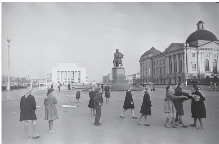
Группа школьников на Пионерской площади; на заднем плане – здание театра юных зрителей. 1960-е гг. Ленинград. Оп. 1АР-100. Ед. хр. 141105.

центральных органов привели к тому, что к середине 1960-х гг. у театральных сотрудников накопился большой опыт работы с юными зрителями, а репертуар стал более разнообразен. Однако даже в этих условиях количество детско-юношеских театров в СССР было недостаточным. Выход из этой ситуации был найден: «В последние годы все большее и большее число театров для взрослых включает в свой репертуар детские пьесы. Причем, если прежде «взрослые» театры ставили для детей только сказки или классику, то теперь они все более охотно обращаются к современным пьесам для подростков» 1 .