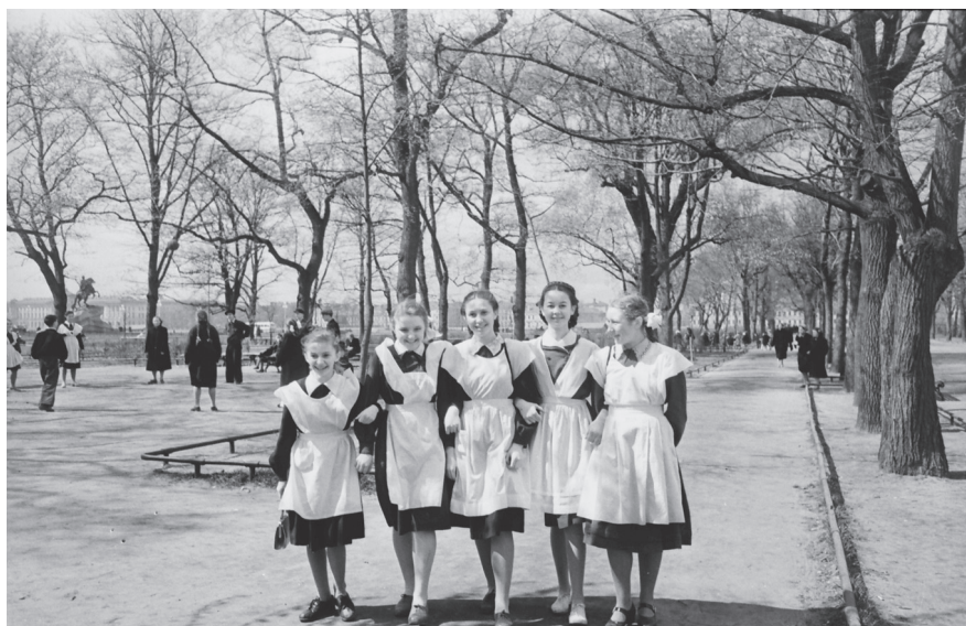
Фотоэтиюд. После экзаменов. 2 июня 1955 г. Ленинград. Автор съемки: П. Машковцев. ЦГАКФФД СПб. Оп. 1АР-77. Ед. хр. 117135.

и др.). Помимо координирующей функции, комиссии вырабатывали рекомендации по улучшению идеологической работы 1 .