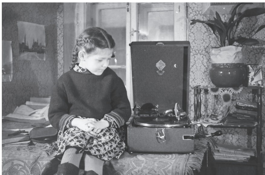
Девочка дома слушает пластинку, сидя у патефона. Конец 1950-х гг. Ленинград.