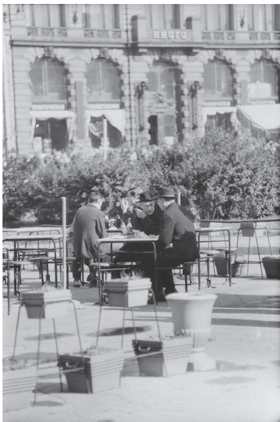
Вид летнего кафе у Дома Книги. Сентябрь 1964 г. Ленинград. Автор съемки: К.В. Овчинников. ЦГАКФФД СПб. Оп. 1АР-164. Ед. хр. 242925.

газинах, ателье, мастерских бытового обслуживания, прачечных и т. д. А ведь минуты складываются в часы, часы – в дни» 1 .