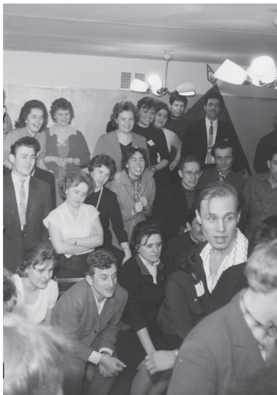
Вечер КВН в студенческом общезитии на улице Ленсовета д. 29. Общий вид зала. Май 1964 г. Ленинград. Автор съемки: Сидоров. ЦГАКФФД СПб. Оп. 1АР-48. Ед. хр. 78961.

Одной из самых распространенных форм работы с человеком на протяжении 1950–1960-х гг. выступала лекция, о чем свидетельствуют статистические данные. Например, при подготовке к празднованию 100-летия со дня рождения В.И. Ленина клубными учреждениями Ленинграда за два с половиной года «было проведено около 5 тыс. тематических вечеров, более 2 тыс. Ленинских чтений, свыше 3 тыс. экскурсий по ленинским местам, прочитано 50 тыс. лекций, организовано более 1300 лекториев и кинолекториев» 1 . В методической лите-