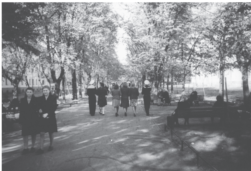
Горожане во время прогулки по бульвару Профсоюзов. 1950-е гг. Ленинград. Оп. 1АР-151. Ед. хр. 208107.

На основе существующих на данный момент философско-методологических моделей измерения советской истории очень сложно понять и правильно оценить такое явление как идеологизация советского общества, которая была характерна для практически каждой сферы жизни человека в СССР. Это проникновение в советскую повседневность проходило как через институциональные рамки, например, через образовательную систему: «У части студентов вызывало непонимание, вернее недоумение, чрезмерная политизация учебного процесса буквально всех учебных заведений страны, начиная со школы и кончая академиями» 1 , – так и вне их. Идеология стремилась стать частью нравственно-эстетического (духовного) мира человека, на что обращали внимание советские ученые: «Коммунистическая мораль неразрывно связана с политикой, иначе и быть не может; моральные принципы нельзя сформулировать отвлеченно, так как нравственных правил,