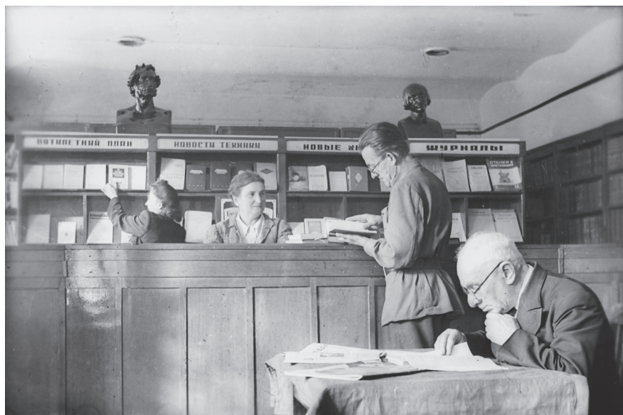
В день открытия библиотеки вагоностроительного завода им. Егорова. 17 сентября 1956 г. Ленинград. Автор съемки: Н. Караваяев. ЦГАКФФД СПб. Оп. 1АР-2. Ед. хр. 2056.

специалисты или читательский актив проводили консультацию 1 , читательские конференции, литературные вечера, громкие читки и беседы 2 .