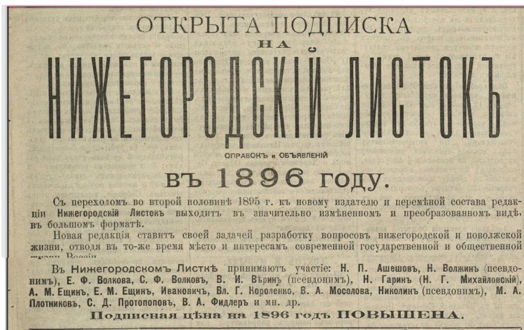
Реклама газеты «Нижегородский листок», 6 ноября 1895 года