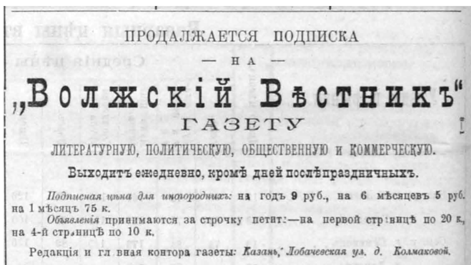
Реклама газеты «Волжский вестник» в нижегородской печати, 1890-е годы