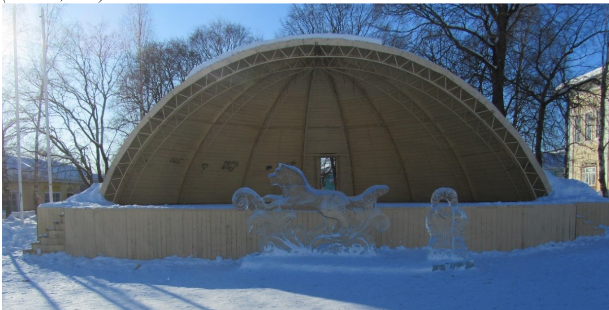
Картинка с ледяного бала. Таких картинок там немало. (Тотьма, 2019)