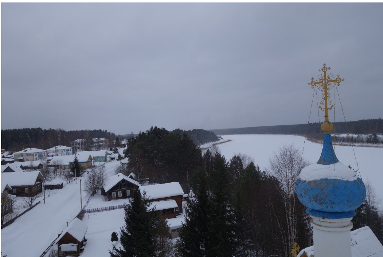
Сухо́на-река с колокольни храма в Усь-Печеньге (Вологодская область, 2020)