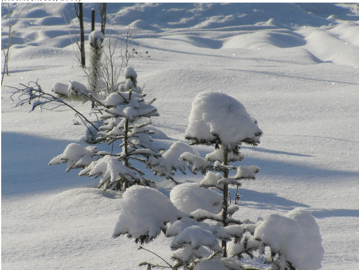
Укрылись сосёночки пушком снежным. Зима покрывало накинула нежно. (Подмосковье, 2007)