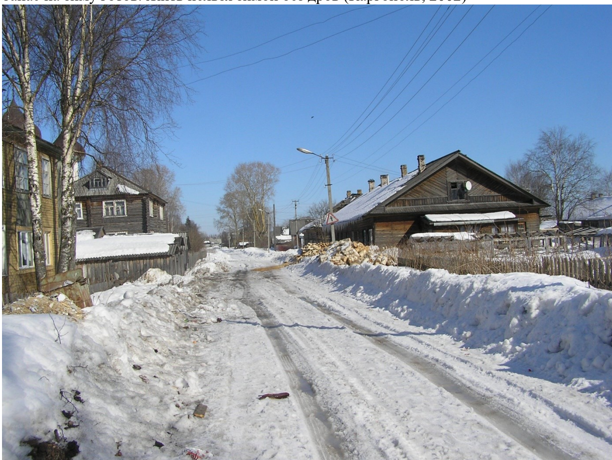
Там дрова и тут дрова – жизнь зимою такова (Каргополь, 2002)