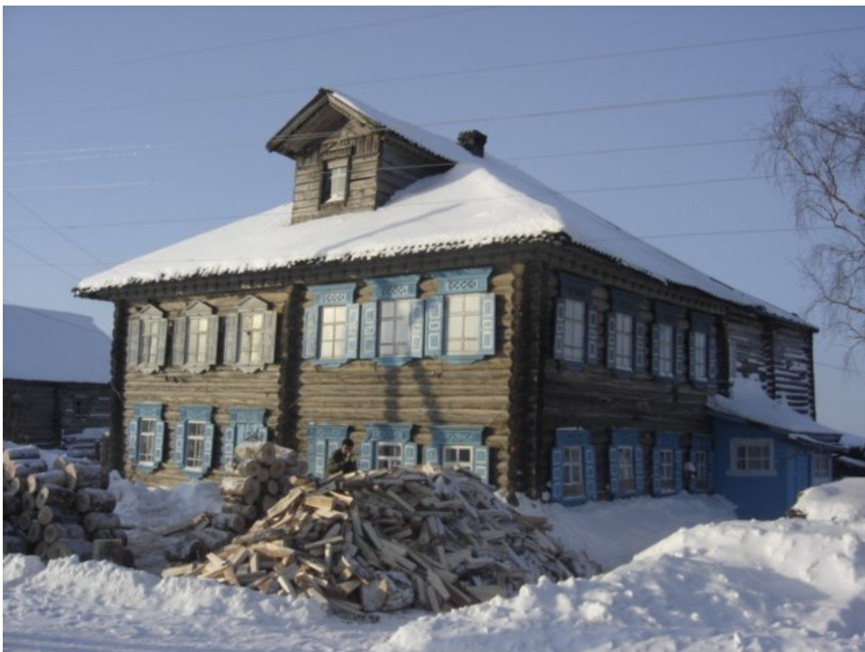
Запас на зиму готов. Жить нельзя зимой без дров (Каргополь, 2002)