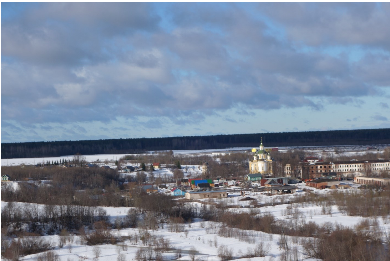
Спасо-Суморин монастырь с колокольни Успенской церкви (Тотьма, 2018)