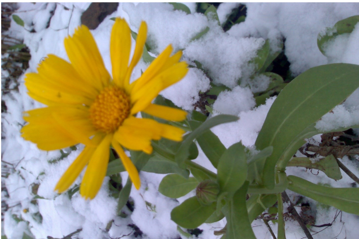
Вот те раз. Цветок раскрылся – зимним снегом, вдруг накрылся. (с. Чернеево в Подмоскowie, 2019)