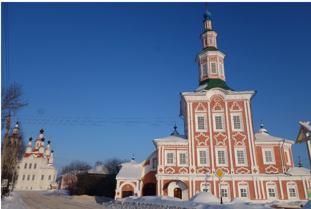
На улице холодно. В храмах тепло. В северном небе на редкость светло (Тотьма 2016)