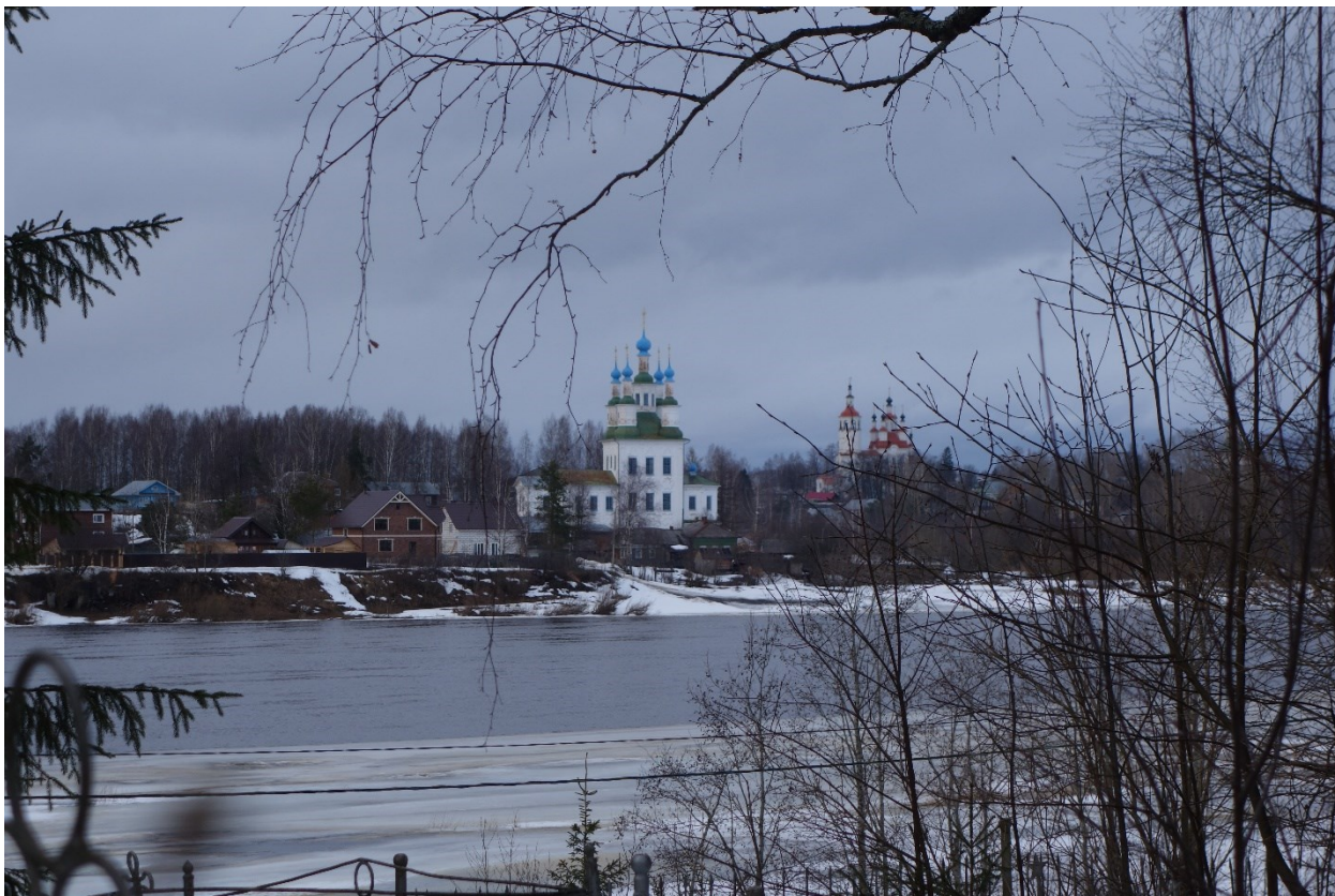
Троицкий храм за Сухоной-рекою, вдали маковки Входоиерусалимского храма (Тотьма, 2018)