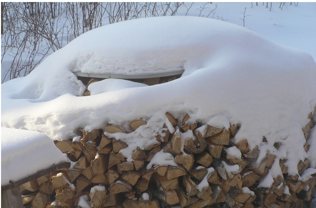
Снегом покрылась поленица дров. Под снежной шапкой хороший укрыв. (Подмосковье, 2006)