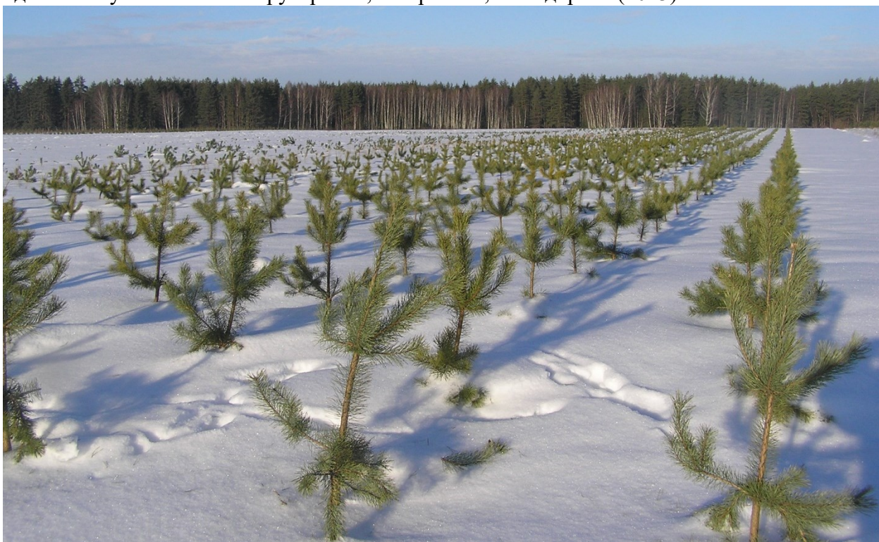
Здесь заячий след в подмосковных посадках на белом снегу ровном и гладком. (2014)