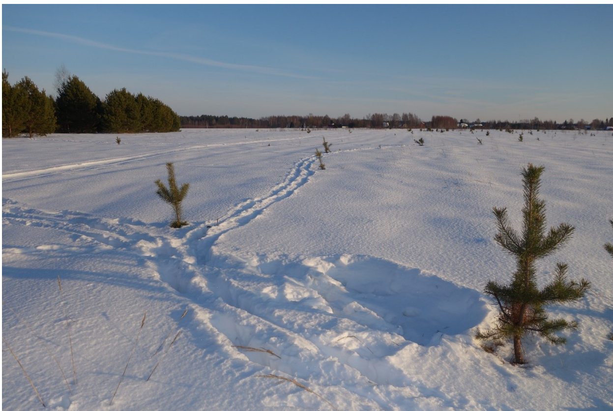
Здесь лёжку оставил лось круторогий, в Чернеево, близ дороги (2023)