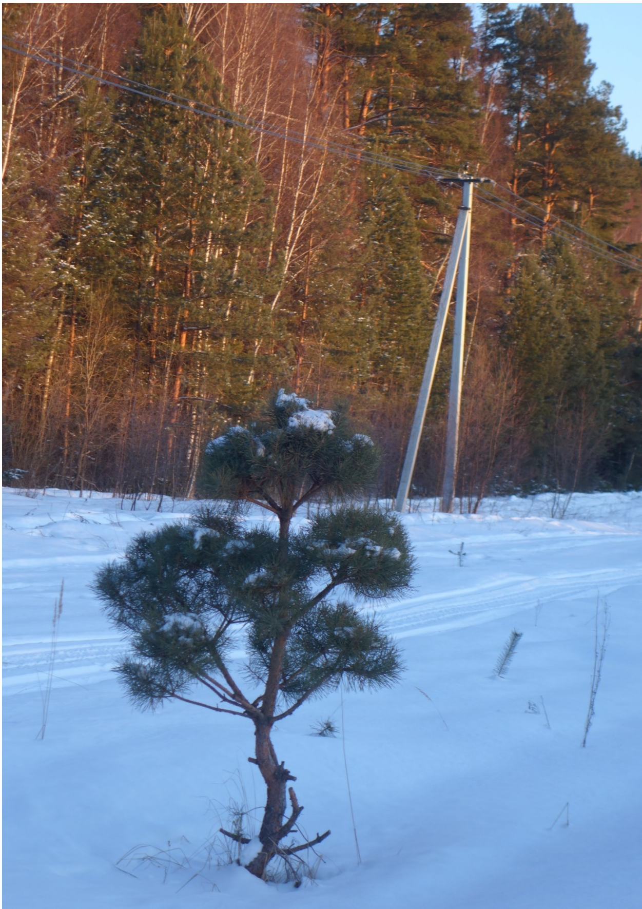
Вдоль дороги одиноко, стоит сосёнка невысока Подрастёт, будет сосна, как за зимой грядёт весна (Подмосковье, 2023)