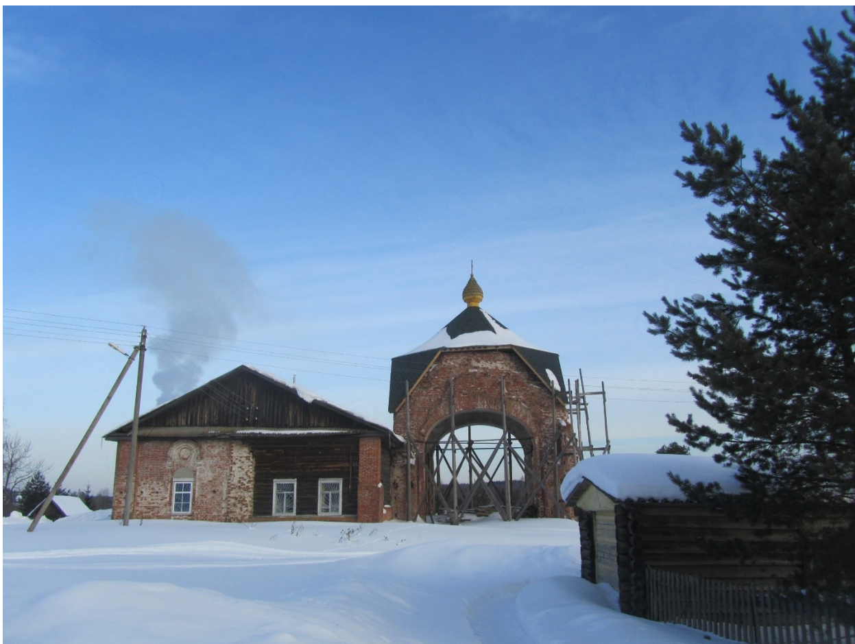
Николаевский храм оживать начинает. Зимой в округе снега наметают (с. Никольское Тотемского района Вологодской области, 2018)