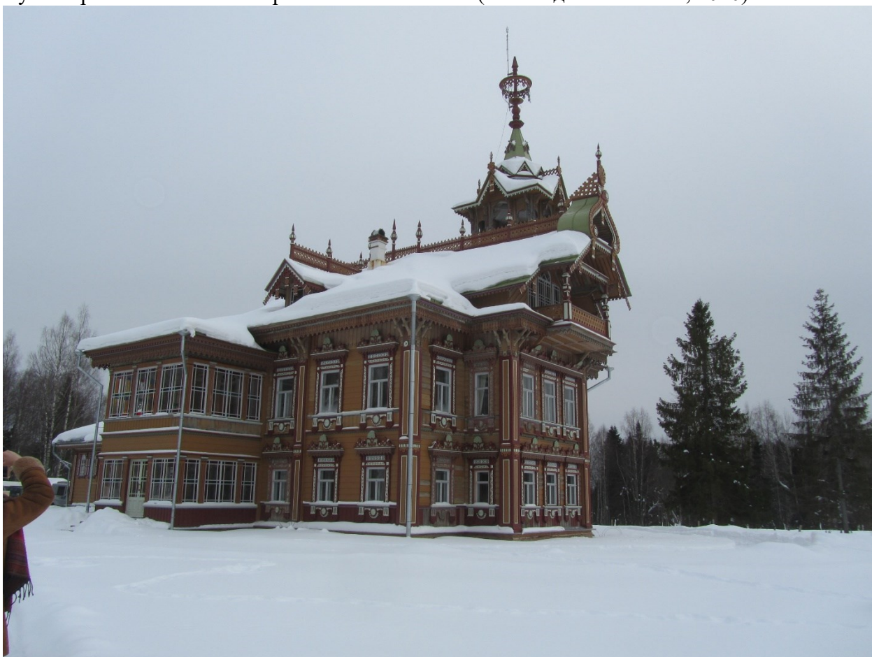
Крестьянский дом-терем в Костромской области. Ныне Гостевой дом. Накопил деньжат предприимчивый крестьянин и возвёл этакий дом-красавицу. (д. Осташёво, 2018)