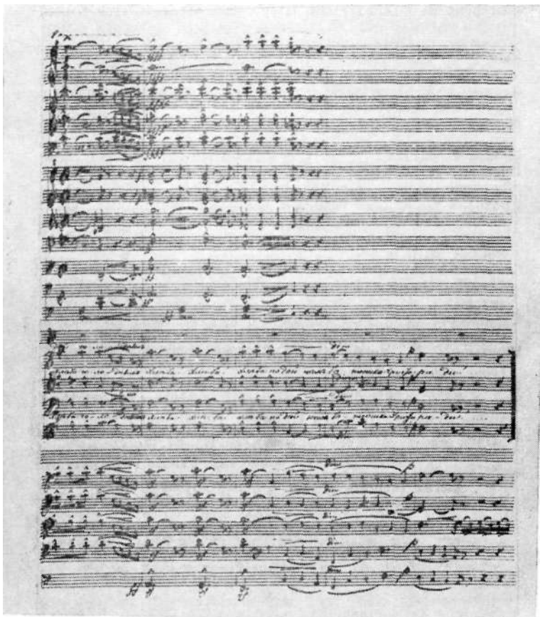
М. П. Мусоргский. Опера «Борис Годунов». Сцена у храма Василия Блаженного Автограф