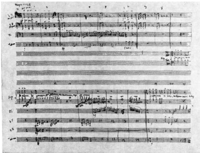
С. С. Прокофьев Музыка к спектаклю «Евгений Онегин». Сцена «Ряженые» Автограф