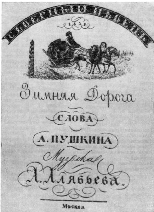
А. А. Алябьев. Обложка 1 издания романа «Зимняя дорога»