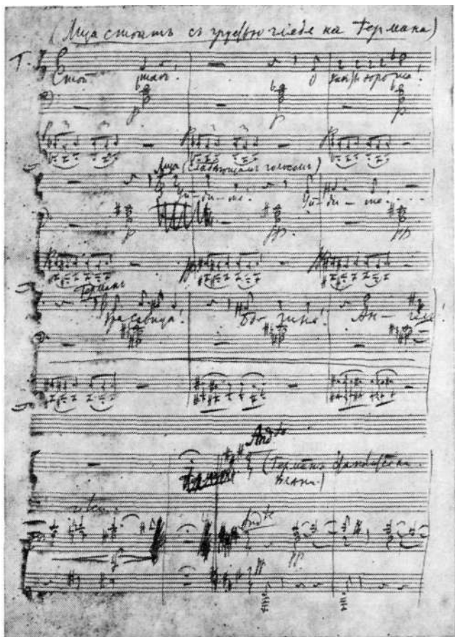
П. И. Чайковский Опера «Пиковая дама», 2-я картина Автограф