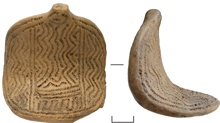
Ил. 4. Неизвестный археологический памятник из Ханты-Мансийского р-на ХМАО — Югры(?). Антропоморфная фигурка

1. Антропоморфная фигурка (ил. 4). Размеры: 4,5x4,7x0,6—1,6 см. Длина нижней части 3,7 см. Материал: керамика. Техника: ручная лепка, орнаментация, обжиг. С левой стороны внизу — скол по грани. Реставрация: кустарная — обработка ПВА. Датировка: XI—XII вв.