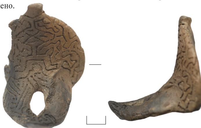
Ил. 6. Неизвестный археологический памятник из Ханты-Мансийского р-на ХМАО — Югры(?). Антропоморфная фигурка

Изделие имеет цвет от коричневого до тёмно-серого цвета; хорошо обожжено.