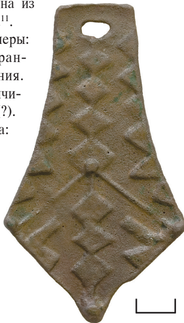
Ил. 3. Городище Усть-Иртышское (Гуланг-Вош). Подвеска лапчатая

Подвеска ромбовидная, с максимальным расширением в нижней трети. На лицевой поверхности украшена рельефным геометрическим орнаментом из ромбов (по центру), треугольников и уголков (по краям). Вверху расположено овальное отверстие для подвешивания. Обратная сторона — без орнамента. Украшение имеет широкий круг аналогий из памятников Севера Западной Сибири.