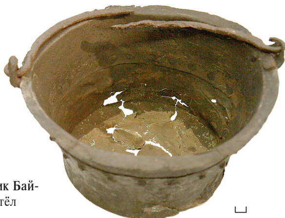
Ил. 37. Могильник Бай- балаковский. Котёл

изображено значительно стилизованное животное с четырьмя прямыми конечностями и длинным хвостом. Голова(?) значительно возвышается над туловищем и составляет единое целое с «хоботом». Такие артефакты относятся к сер. II тыс. и являются сильно стилизованными зооморфными или орнитоморфными полыми подвесками более ранних эпох.