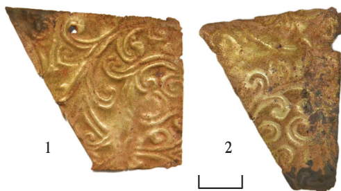
Ил. 19. Могильник Байбалаковский. Фрагменты изделия

3. Фрагменты изделия — 2 шт. (ил. 19). Бронза или серебро. Коррозия, загрязнения. Датировка: нач. — сер. II тыс.(?).