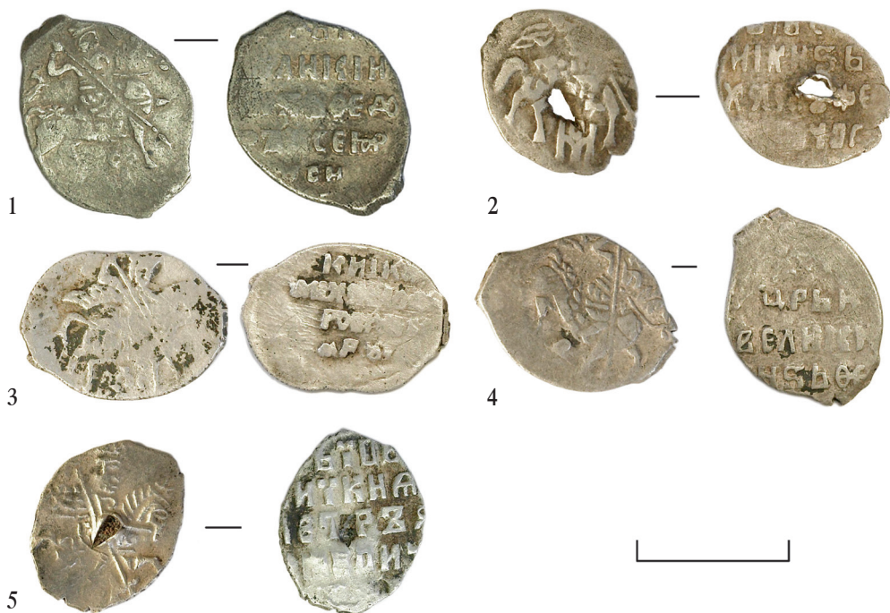
Ил. 43. Могильник Байбалаковский. Монеты («чешуйки»)