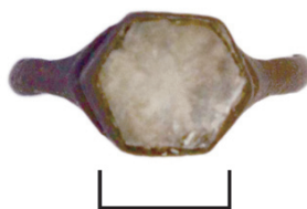
Ил. 32. Могильник Байбалаковский. Перстень

Перстень с щитком-кастом в виде шестиугольника. Вставка сохранилась, но плохо. Шинка рельефная, треугольная в сечении.