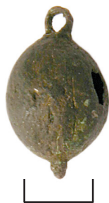
Ил. 21. Могильник Байбалаковский. Пуговица

В верхней части — круглая петелька для крепления. Подобные изделия являлись предметами русского импорта в XVI—XVII вв. 16