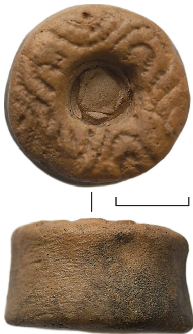
Ил. 10. Неизвестный археологический памятник из Ханты-Мансийского р-на ХМАО — Югры(?). Цилиндрическая фигурка

8. Бусина (ил. 11). Размеры: длина 4,1 см, диаметр макс. 2,0—2,2 см по экватору. Отверстие 0,25—0,26 см. Материал: стекло(?). Сохранность: трещины, скол, следы термического воздействия. Датировка: XI—XII вв.(?).