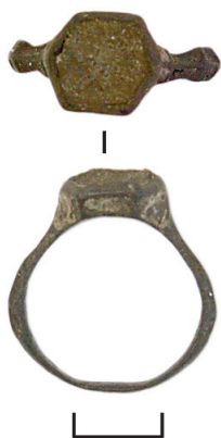
Ил. 33. Могильник Байбалаковский. Перстень

19. Перстень (ил. 33). Медь, стекло. Коррозия, загрязнения. Датировка: XVII—XVIII вв.