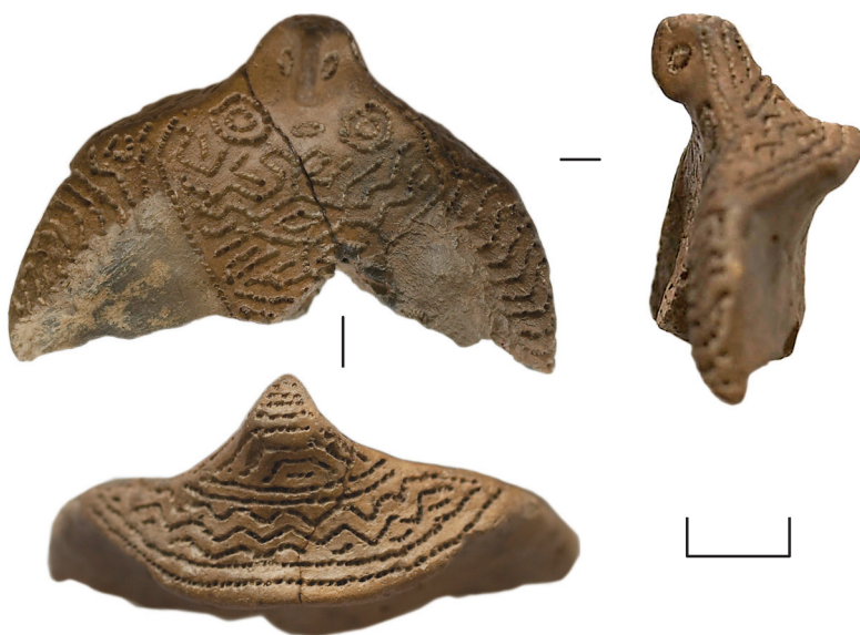
Ил. 7. Неизвестный археологический памятник из Ханты-Мансийского р-на ХМАО — Югры(?). Орнитоморфная фигурка

Изделие имеет цвет от коричневого до коричнево-серого цвета; хорошо обожжено.