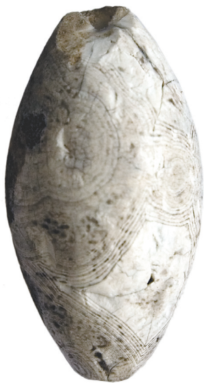
Ил. 11. Неизвестный археологический памятник из Ханты-Мансийского р-на ХМАО — Югры(?). Бусина