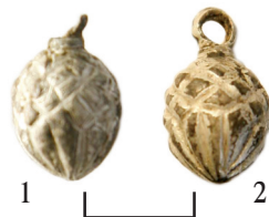
Ил. 20. Могильник Байбалаковский. Пуговицы

Пуговицы литые, яйцевидной формы, украшенные рельефной сеткой. Хорошая сохранность даёт основание предполагать, что они, возможно, изготовлены из серебра. Пространство между ячейками покрыто чернью(?).