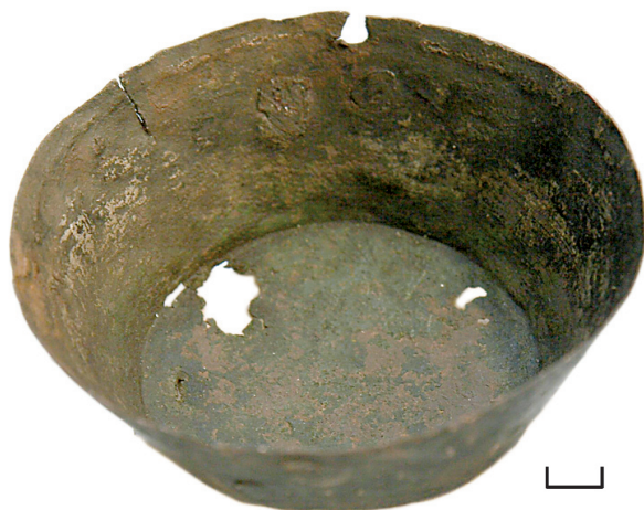
Ил. 38. Могильник Байбалаковский. Котёл

Котёл чашеобразной формы. По устью сохранилась пара отверстий для крепления дужки. Дно слегка выгнуто.