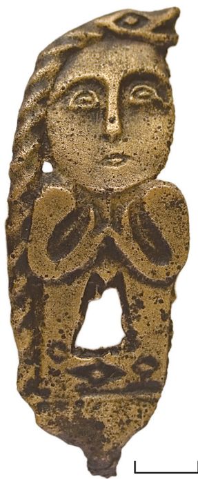
Ил. 15. Неизвестный археологический памятник из Ханты-Мансийского р-на ХМАО — Югры(?). Бляха антропоморфная

Бляха плоская, с рельефом, ажурная, в виде антропоморфной фигуры, окаймлённой с левой стороны змеёй(?). У антропоморфа крупная овальная голова. Лоб и нос (шлем с наносьем?) показаны с помощью сплошного высокого рельефа. Глаза миндалевидные, окантованы валиком, зрачки переданы с помощью дополнительного рельефа в виде горизонтальных коротких линий. Рот маленький, ромбовидный, в виде углубления. Шеи нет, торс короткий. Плечи округлые, массивные. Руки антропоморфа, показанные высоким рельефом, в области груди плавно согнуты (без подчёркивания локтевого сгиба) двупальными кистями к подбородку. Ноги прямые, широко расставлены и развёрнуты носками друг к другу. Ступни изображены в виде профильных голов зооморфных существ; их раскрытые пасти соприкасаются друг с другом и образуют таким образом ромб, в центр которого помещена округлая «жемчужина». На этих головах детализированы только ромбовидные глаза со зрачком. У персонажа показан признак мужского пола в виде небольшого треугольного выступа.