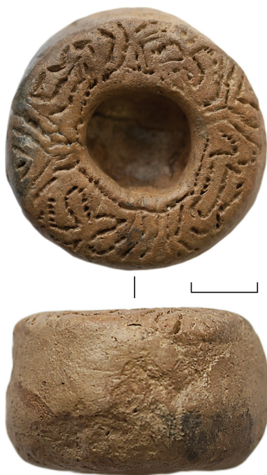
Ил. 9. Неизвестный археологический памятник из Ханты-Мансийского р-на ХМАО – Югры(?). Цилиндрическая фигурка

Фронтальная сторона богато украшена геометрическим декором. Конечности не выделены. Нижняя поверхность изделия без орнамента, заглажена.