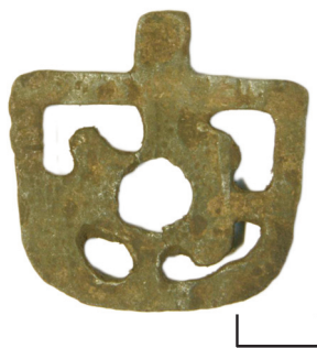
Ил. 26. Могильник Байбалаковский. Нашивка

Нашивка в виде плоской, с рельефом, ажурной арки. От плоской стороны нашивки отходит небольшой язычок. Внутреннее пространство арки занято перемычками, образующими четырёхлепестковый цветок.