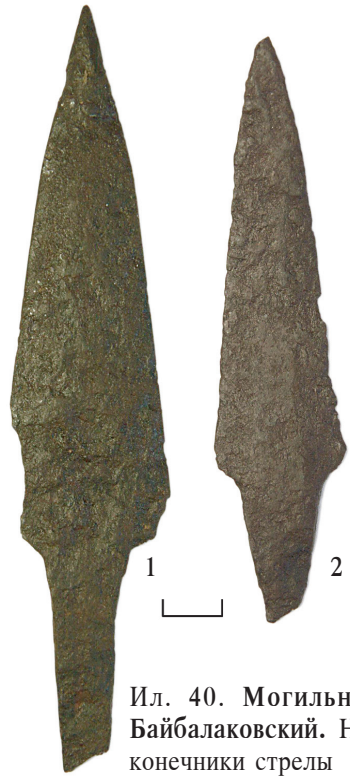
Ил. 40. Могильник Байбалаковский. На- конечники стрелы

Наконечники стрелы плоские, ром- бические, с выделенным длинным насадом. Максимальное расширение пера — в верхней трети. Имеют широкий круг аналогий и период бытования.