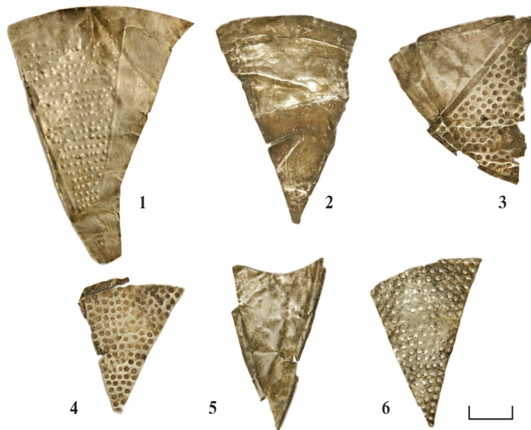
Ил. 18. Могильник Байбалаковский. Фрагменты изделия из серебряной фольги

Последние посередине украшены пятью витками скани. Возле бусин и между ними — обмотка из скани. Имеет широкий круг аналогий в памятниках Прикамья 15 .