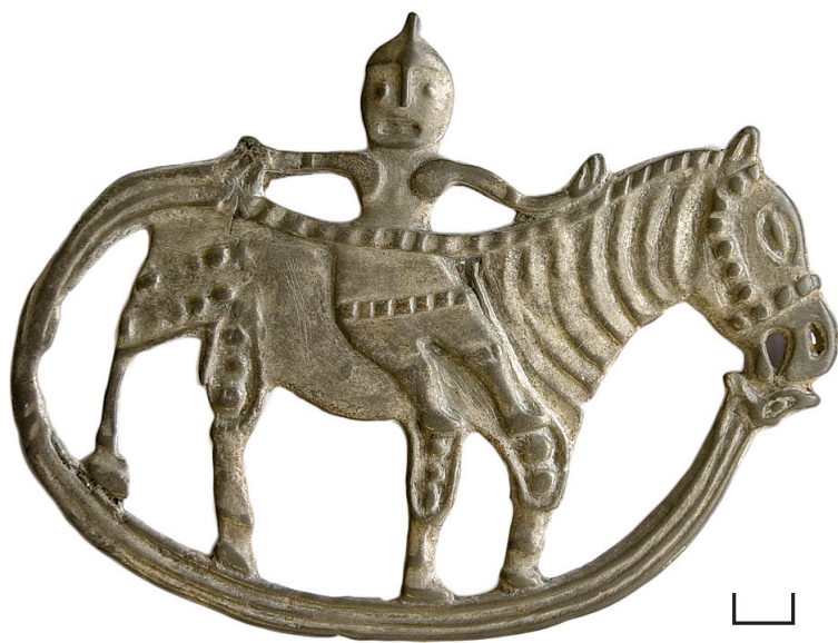
Ил. 2. Городище Усть-Иртышское (Гуланг-Вош). Ажурная металлопластика с рельефом в виде фигурки всадника на коне

Конь показан в проекции «вид сбоку». Голова крупная, по форме близка естественным контурам животного, с одним маленьким округлым ухом. Рот приоткрыт. Ноздря передана каплевидным углублением, миндалевидный глаз с выделенным зрачком — углубленным овалом, элементы уздечки — линиями выпуклых «жемчужин». Шея животного от холки до горла декорирована линией поперечных узких валиков. От уха начинается рельефная узкая полоса, идущая по холке и спине, через линию талии наездника и заканчивающаяся около хвоста под ладонью наложенной здесь руки всадника. Туловище коня короткое, со слегка провисшим животом. Круп и отставленная назад задняя нога животного недооформлены, видимо, из-за недолива металла. Четыре конечности короткие, прямые. Верхние части конечностей оформлены картушами с крупными круглыми «жемчужинами» внутри. Опущенный хвост в виде трёх продольных валиков книзу сужается и соединяется с поднятым хвостом змееподобного существа, подстилающего снизу фигуру коня.