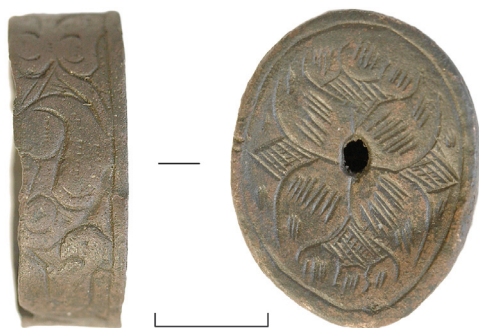
Ил. 23. Могильник Байбалаковский. Обойма рукояти ножа

9–10. Пряжки ременные — 2 шт. (ил. 24). Железо, медь. Коррозия, загрязнения. Датировка: втор. пол. II тыс.