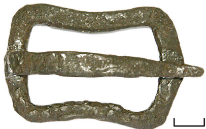
Ил. 25. Могильник Байбалаковский. Пряжка ременная

12. Нашивка (ил. 26). Олово. Отлита в односторонней форме. Коррозия. Датировка: XVI–XVII вв.