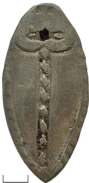
Ил. 14. Неизвестный археологический памятник из Ханты-Мансийского р-на ХМАО — Югры(?). Бляха с изображением рыбы

Бляха плоская, овальной формы, с рельефом, в виде стилизованного изображения рыбы(?). По краю, кроме области головы, украшена сильно затёртым к сегодняшнему дню псев-