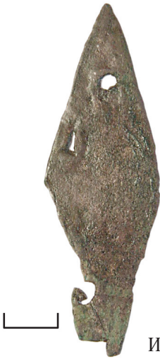
Ил. 39. Могильник Байбалаковский. Наконечник стрелы

25. Наконечник стрелы (ил. 39). Медь. Коррозия, загрязнения, утраты. Датировка: сер. II тыс.