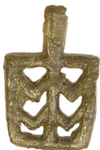
Ил. 27. Могильник Байбалаковский. Нашивка

Нового времени (например, в материалах Надымского городка) 20 .