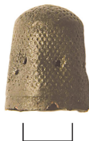
Ил. 22. Могильник Байбалаковский. Напёрсток

7. Напёрсток (ил. 22). Медь. Коррозия, загрязнения, утраты по краю, деформация. Датировка: