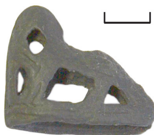
Ил. 36. Могильник Байбалаковский. Подвеска с зооморфным изображением