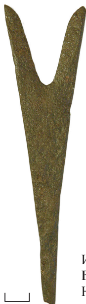
Ил. 42. Могильник Байбалаковский. Наконечник стрелы

30. Наконечник стрелы (ил. 42). Железо. Коррозия. Датировка: нач. — втор. пол. II тыс.