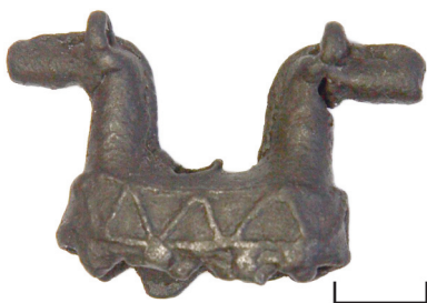
Ил. 35. Могильник Байбалаковский. Подвеска коньковая

Подвеска полая, ажурная, с рельефом. На овальном в сечении основании, состоящем из нескольких рядов горизонтальных валиков,