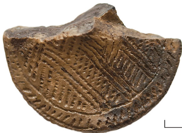
Ил. 8. Неизвестный археологический памятник из Ханты-Мансийского р-на ХМАО – Югры(?). Фрагмент антропоморфной фигурки