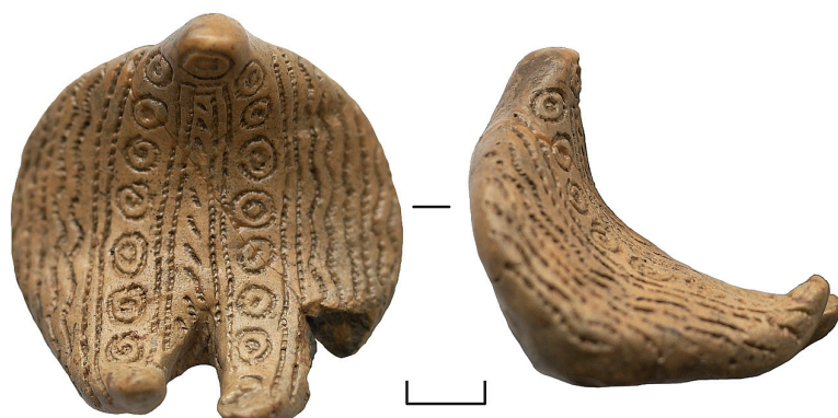
Ил. 5. Неизвестный археологический памятник из Ханты-Мансийского р-на ХМАО — Югры(?). Антропоморфная фигурка

Ноги фигурки слегка загнуты вверх. Поверхность, имитирующая спину, заглажена, без орнамента, слегка неровная (от вдавлений от пальцев). Основание заглажено, без декора, слегка вогнуто.