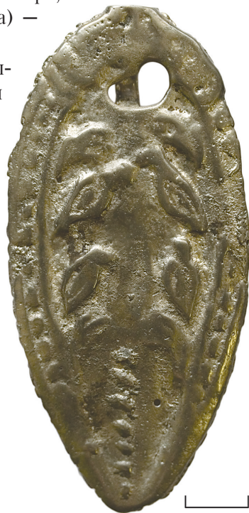
Ил. 13. Неизвестный археологический памятник из Ханты-Мансийского р-на ХМАО — Югры(?). Бляха с изображением птиц

Плоская металлопластика с рельефом. По форме близка к овалу. Расположение геральдической композиции вертикальное. Края оконтурены профильными узкими вытянутыми туловищами двух неопределённых существ, которые вверху повернуты мордами друг к другу. Голова левого персонажа сильно затёрта, и можно