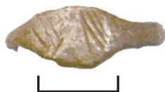
Ил. 34. Могильник Байбалаковский. Перстень

Перстень с овальным щитком. По краям щитка около шинки имеются насечки. Шинка округлая. Перстни являются довольно частой находкой в погребениях Нового времени и имеют широкий круг аналогий.