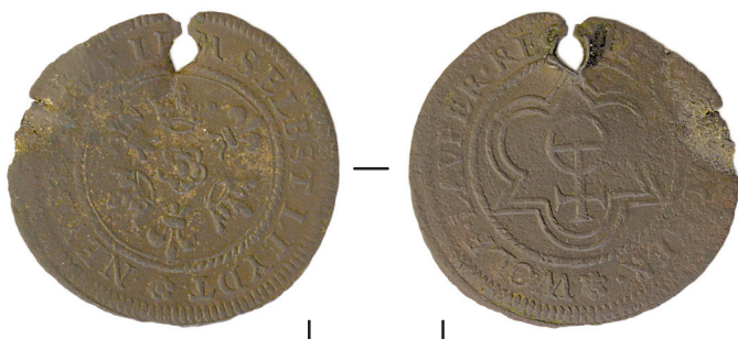
Ил. 44. Могильник Байбалаковский. Счётный жетон нюрнбергский

36. Счётный жетон нюрнбергский (ил. 44). Медь. Коррозия, утраты. Период бытования: XVI–XVII вв.