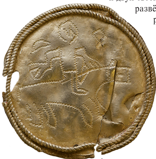
Ил. 12. Неизвестный археологический памятник из Ханты-Мансийского р-на ХМАО — Югры(?). Бляха с изображением всадника

Изделие имеет цвет от грязно-белого до серого с разводами.