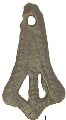
Ил. 29. Могильник Байбалаковский. Подвеска лапчатая