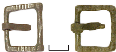
Ил. 24. Могильник Байбалаковский. Пряжки ременные

Пряжка в виде прямоугольника, сжатого по длинным сторонам вовнутрь. К одной из коротких сторон прикреплен язычок.