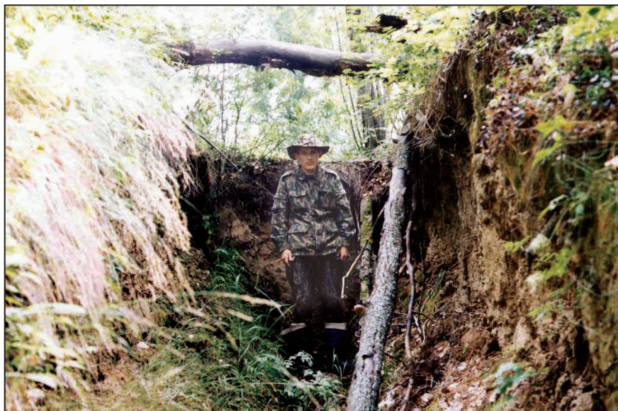
Ил. 1. Городище Усть-Иртышское (Гуланг-Вош). Траншея. 1999 г.

какие-либо выводы о времени существования памятника. Ситуация сегодняшнего дня неизвестна. Здесь публикуются единственные известные датирующие артефакты с памятника, о котором знают более 250 лет и который, вероятно, ежегодно продолжает осыпаться и разрушаться.