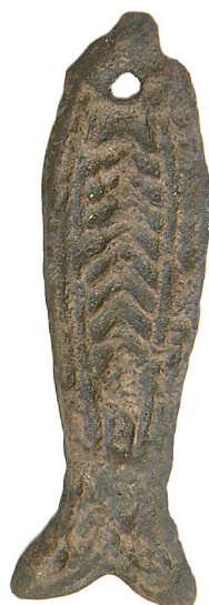
Ил. 28. Могильник Байбалаковский. Икhtiоморфная подвеска

Подвеска плоская, ажурная, с рельефом, в виде лапки водоплавающей птицы. Перемычки